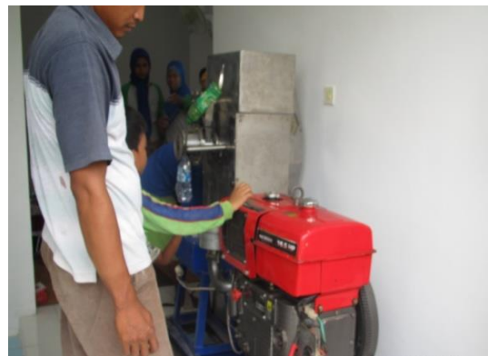
Gambar 2. Mesin Extruder Snack jagung