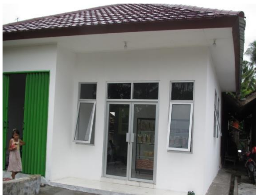
Gambar 1. Rumah Produksi

Tahun 2014, Tim Pengabdian pada masyarakat Universitas Lampung, memperkenalkan dan sekaligus melatih proses pembuatan produk keripik tortilla jagung, disamping tetap melakukan pendampingan Industri Rumah Tangga abon cabe melalui skema pendanaan IbM DIKTI (Nurdjanah dkk., 2014). Dalam perkembangannya, berbagai jenis produk olahan telah diproduksi, namun produk tortilla merupakan produk yang paling diminati dan paling berpotensi untuk dikembangkan. Berkat keuletan anggota KWT Kemuning II dalam menjalankan usahanya, Dinas Pertanian Tanaman Pangan dan Hortikultura Propinsi Lampung memberikan bantuan berupa rumah produksi beserta perlengkapan yang diperlukan. Seiring dengan bantuan rumah produksi (Gambar 1), Tim Pengabdian Unila juga melanjutkan pembinaan pengembangan usaha snack jagung melalui pendanaan dari IPTEKDA LIPI 2015 dengan mengupayakan peningkatan kualitas sumber daya manusia melalui serangkaian pelatihan, serta hibah peralatan produksi skala semi komersial berupa Extruder dan mesin Pengemas Otomatis seperti ditunjukkan pada Gambar 2 dan 3 (Nurdjanah dkk., 2015).