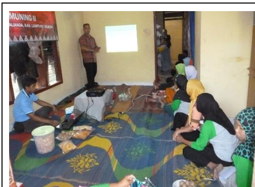
Gambar 5. Peserta sedang mendengarkan materi pelatihan tentang pembukuan