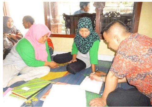
Gambar 6. Peserta sedang praktek melakukan pembukuan