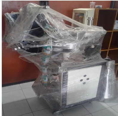
Gambar 3. Mesin Pengemas Otomatis

Meskipun sudah mengalami perkembangan usaha yang menggembirakan, masih terdapat berbagai masalah yang harus dibantu dicarikan solusinya untuk memajukan usaha tersebut. Masalah utama produksi rendah karena mesin pengolah dan pengemas belum dioperasikan serta pengetahuan tentang manajemen usaha yang kurang memadai. Oleh karena itu akan dilakukan peningkatan volume dan kualitas produksi snack jagung secara bertahap sehingga di akhir program, akan dapat diperoleh ijin BPPOM-MD, sehingga memiliki jangkauan pemasaran yang lebih luas serta daya saing tinggi. Solusi yang dapat dilakukan secara bertahap antara lain dengan penyediaan pendampingan pengoperasian peralatan extruder dan mesin pengemas serta pengelolaan usaha berskala UMKM yang dilakukan oleh KWT Kemuning berupa snack jagung dapat dikembangkan menjadi produk unggulan Lampung Selatan yang tentunya akan memberikan multiplier effect bagi pertumbuhan ekonomi hulu hingga hilir mulai dari petani sebagai penghasil bahan baku, produsen maupun masyarakat Lampung selatan terutama dalam hal penyerapan tenaga kerja.