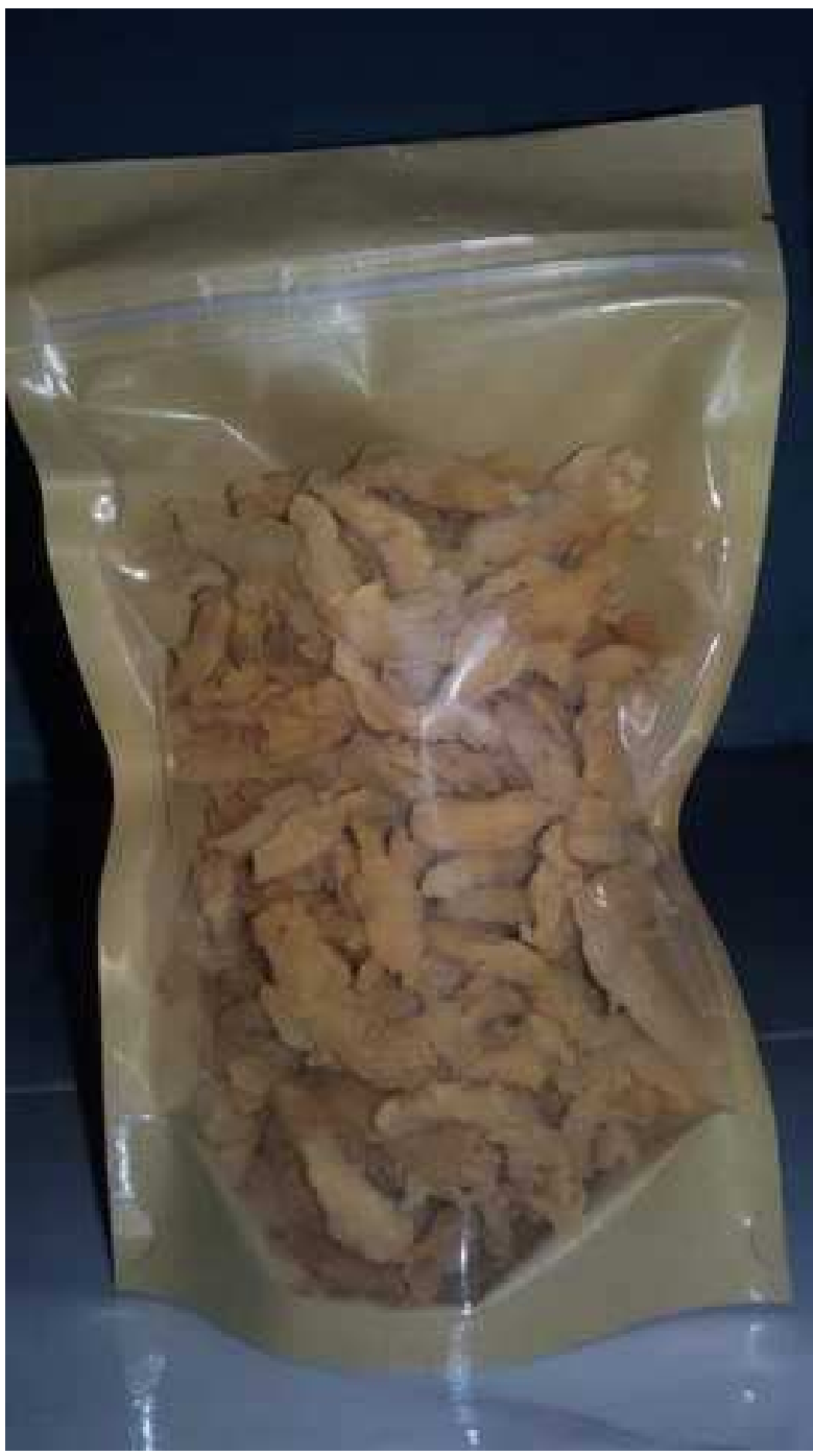
Jamur Krispi Rasa Original