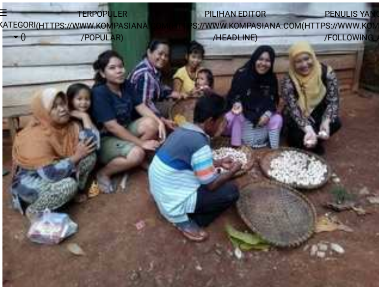
Panen Jamur Merang

Kegiatan pengabdian Program Kemitraan Masyarakat dilakukan pada usaha produk olahan makanan berbasis jamur yang diharapkan memiliki jangkauan pemasaran yang lebih luas. Selain itu produk ini diharapkan memiliki masa simpan yang lebih lama dan dapat dijual di toko-toko atau supermarket .