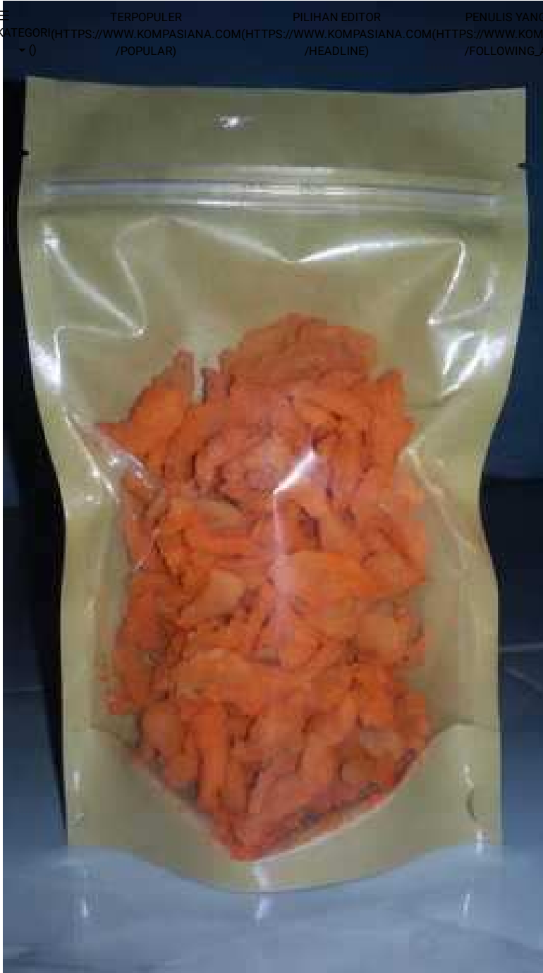
Jamur Krispi Rasa Balado