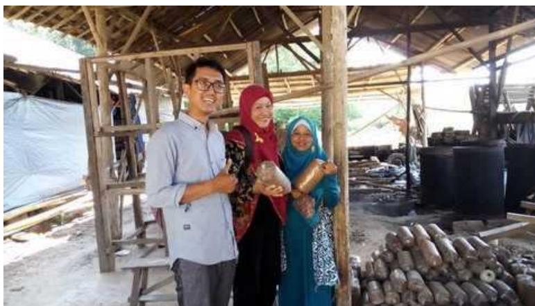
Di depan kumbung jamur, diantara baglog jamur tiram

Dalam hal ini dipilih produk yang akan dikembangkan adalah kerupuk jamur dan jamur krispi. Secara umum kerupuk adalah makanan yang merakyat dan banyak digemari masyarakat di berbagai daerah di tanah air. Rasa kerupuk yang renyah membuat makanan ini tak pernah absen dari sajian santapan saat makan maupun untuk camilan.