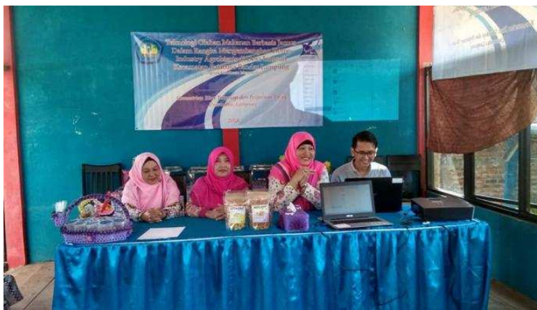
Tim Pengabdian Memberikan Materi Pelatihan

Kedua produk makanan berbasis jamur tersebut memiliki prospek yang cerah untuk dipasarkan secara lebih luas. Pemasaran bisa secara off line maupun on line . Sehingga diharapkan keuntungan akan meningkat dan tingkat perekonomian para pembudidaya jamur tersebut juga meningkat