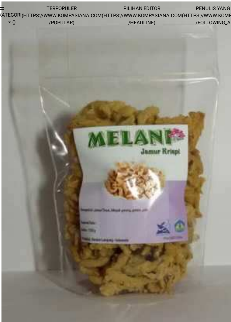
Produk Jamur Krispi

Pembuatan kerupuk jamur yang dicoba oleh Tim Pengabdian dan petani jamur, sangat mudah dan sederhana. Pada pembuatan kerupuk jamur ini yang sulit adalah tahapan memotong kerupuk tipis-tipis. Oleh karena itu diperlukan alat pemotong kerupuk yang diharapkan akan memudahkan pekerjaan dalam memproduksi kerupuk jamur. Kerupuk jamur yang dihasilkan ini memiliki rasa yang gurih dan renyah.