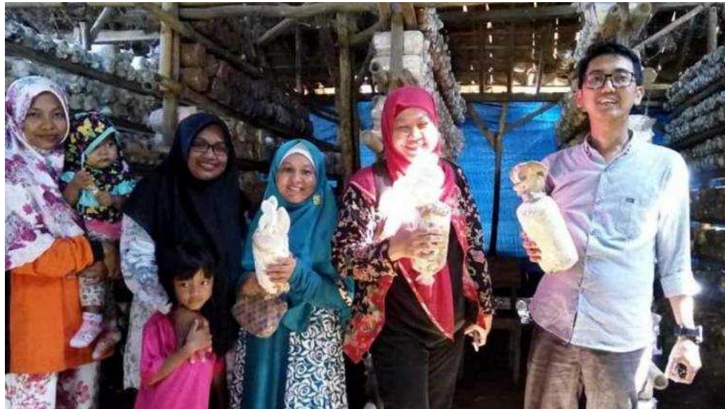
(https://assets-a2.kompasiana.com/items/album/2018/09/21/bersama-petani-jamur-di-kumbang-5ba48a3aab12ae23cc26cab3.jpg?t=o&v=760) Di Kumbang Jamur Tiram

21 September 2018 13:59 | Diperbarui: 16 Oktober 2018 15:35 | 228 | 1 | 0