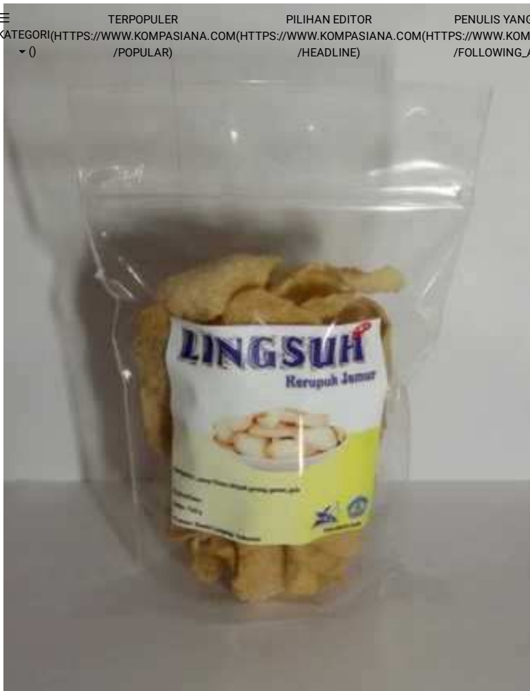
Produk Kerupuk Jamur