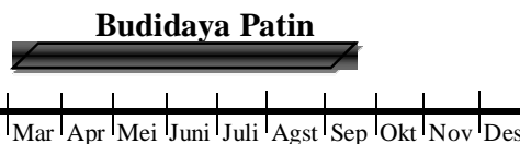
Gambar 1. Musim tanam budidaya ikan patin di Kecamatan Seputih Raman tahun 2015

Proses akhir budidaya adalah panen. Ikan patin dapat dipanen saat ukuran ikan mencapai 500 gram per ekornya atau 150 hari setelah tanam. Proses panen ikan menggunakan waring dan langsung didistribusikan menggunakan mobil pickup pedagang pengumpul. Kegiatan budidaya ikan patin 1 – 2 kali dalam setahun. Hal ini tergantung pada ketersediaan air kolam, karena kolam budidaya yang digunakan yaitu kolam jenis tadah hujan.