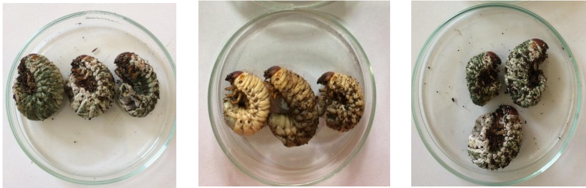
(a) (b) (c) Gambar 3. Gejala larva O. rhinoceros mati terinfeksi Metarhizium sp. isolat Salatiga (a), isolat Tegineneng Lampung (b), dan isolat Natar Lampung (c)