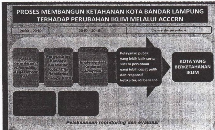
Gambar 1 : Tahapan Kegiatan Adaptasi Perubahan Iklim Bandar Lampung melalui ACCRN

mitigasi. Namun karena upaya-upaya itu belum merujuk pada satu tujuan utama yaitu tujuan pada antisipasi dampak perubahan iklim. Hal iniberrarti bahwa upaya tersebut hanya merupakan bagian wajib dari program pembangunan.