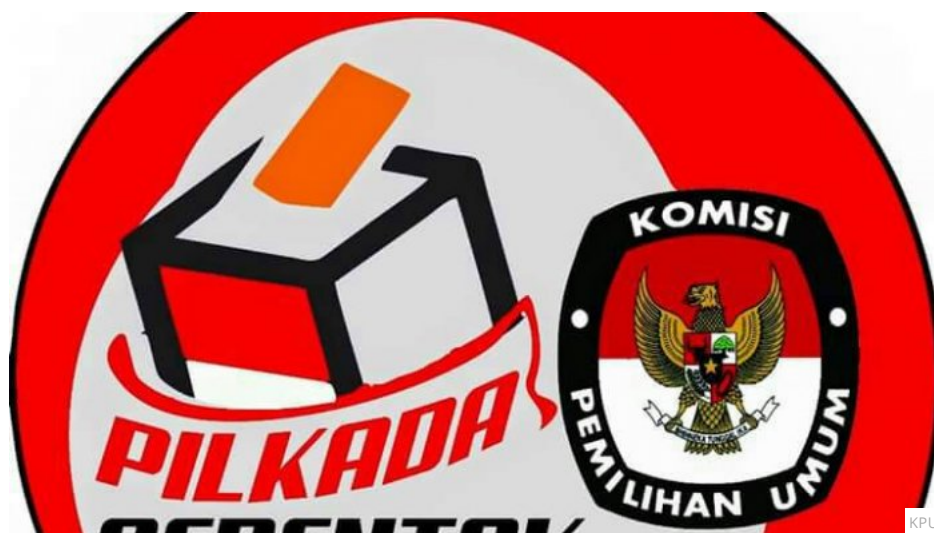
Pilkada serentak akan digelar 27 Juni 2018.

Laporan Reporter Tribun Lampung Bayu Saputra