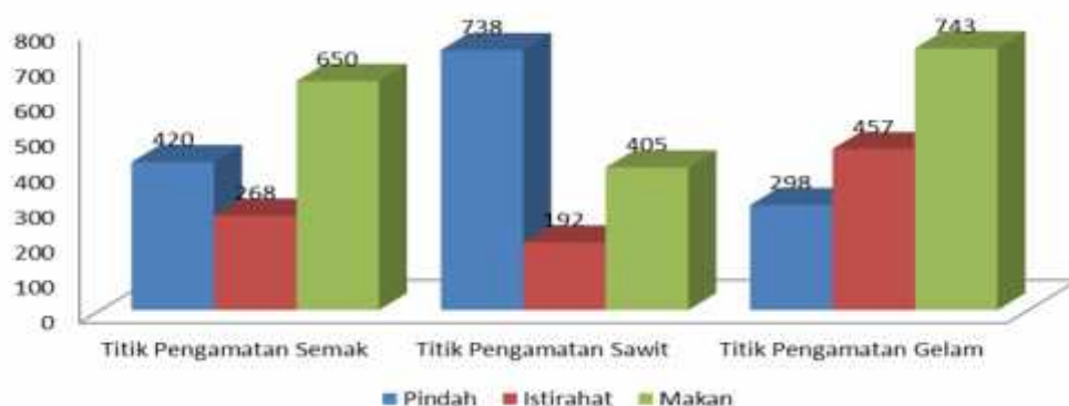
Gambar 1. Diagram aktivitas burung pada setiap titik pengamatan.

Pengamatan dilakukan dengan mencatat perjumpaan burung dan aktivitasnya pada setiap titik pengamatan. Pada titik pengamatan semak burung lebih banyak dijumpai mencari makan ditepi kanal, selain itu burung dijumpai terbang di sekitar lokasi pengamatan kearah barat dan utara, dan burung dijumpai hinggap dan bermain di vegetasi semak. Di sisi lain pada titik pengamatan kebun kelapa sawit burung lebih banyak melakukan aktivitas pindah, burung lebih sering terlihat terbang di sekitar titik menuju kearah timur. Di sisi lain pada titik pengamatan vegetasi gelam burung lebih sering melakukan aktivitas istirahat dan aktivitas makan. Pada titik pengamatan ini burung lebih sering dijumpai mencari makan di tepi kanal dan hinggap, bermain, dan berlindung pada vegetasi gelam. Menurut Syahadat, Erianto, dan Siahaan (2015) bahwa burung cenderung akan memilih struktur vegetasi yang baik dan terlindung, sehingga burung merasa lebih aman untuk beraktivitas. Kondisi habitat dan tipe vegetasi berpengaruh terhadap keberadaan dan aktivitas burung, jika kondisi habitatnya rusak maka keberadaan burung pada lokasi penelitian akan berkurang, sehingga akan berpengaruh terhadap keberlangsungan wisata birdwatching . Menurut Rohiyan (2014), burung akan memilih habitat yang memiliki kelimpahan sumberdaya bagi kelangsungan hidupnya, sebaliknya jarang atau tidak ditemukan pada lingkungan yang kurang menguntungkan baginya. Aktivitas burung pada setiap titik pengamatan disajikan dalam Gambar 1.