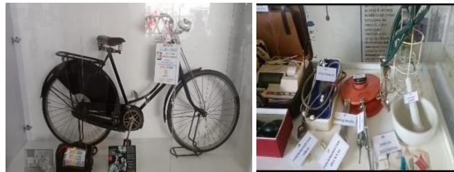
Gambar: Beberapa Koleksi di Museum Santa Maria

Museum Mini Santa Maria, museum pertama di Kota Metro yang berdiri pada tahun 2022 berkat gotong-royong berhasil mendirikan museum mini Santa Maria ini. Galeri sejarah dan mini Museum Klinik Santa Maria Kota Metro menampilkan sejarah perkembangan penyebaran Katolik di Lampung serta Metro dan juga sejarah berdirinya Rumah Sakit St. Elisabeth pada 1938 yang belakangan berganti nama menjadi Rumah Sakit Santa Maria hingga kini.