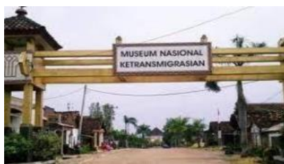
Gambar: Museum Nasional Ketransmigrasian