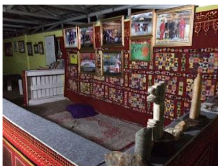
Gambar: Foto, lukisan dan situs peninggalan sisa letusan gunung Krakatau

Museum Krakatau terletak di Desa Tajimalela, Kecamatan Kalianda, Kabupaten Lampung Selatan. Museum Krakatau terbentuk atas perwujudan dari adanya letusan gunung Krakatau. Museum Krakatau merupakan museum yang utamanya berisi dengan berbagai peninggalan letusan gunung api Krakatau pada tahun 1883. Peninggalan tersebut berupa gambar dan maket letusan gunung api Krakatau, Artefak batu fosil hasil letusan gunung api Krakatau, Material Letusan Krakatau, Lukisan, foto, dan surat kabar peristiwa letusan gunung Krakatau, dampak letusan tsunami di lokasi Banten dan Lampung, Dokumentasi video film dari BBC Landon, Jerman dan vulkanologi Indonesia, Hasil penelitian di antartika endapan Abu letusan Krakatau.