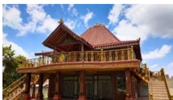
Gambar: Museum Kedatuan Keagungan Lampung

Kedaton Keagungan adalah sebuah bangunan kedaton di Lampung yang berfungsi sebagai museum kecil untuk melestarikan sarana-sarana adat Lampung. Sarana-sarana adat ini telah diwariskan secara turun-temurun sejak zaman Kedotuan berada di puncaknya, dan warisan ini diteruskan melalui keturunan seperti Nuban dan Subing. Museum ini berdiri sebagai upaya untuk memelihara dan menjaga budaya masyarakat Lampung dalam menghadapi perkembangan zaman. Ini mencakup penataan dan pemeliharaan sarana serta nilai-nilai adat Lampung, yang merupakan inti dari Kedaton Lampung.