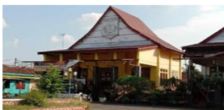
Gambar: Museum Mini Lampung Utara

Kabupaten Lampung Utara terdapat sebuah museum bernama Museum Mini Lampung Utara yang terletak di jalan Alamsyah Ratu Perwira Negara, Kel. Kelapa Tujuh, Kec. Kotabumi Selatan. Museum ini berada di pinggir jalan utama dan bersebelahan dengan kantor PKK.