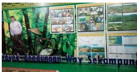
Gambar: Informasi Pembangunan Bendungan Way Sekampung