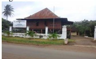
Gambar: Museum Purbakala

Museum Purbakala secara administratif berlokasi di Desa Pugung Raharjo, Kecamatan Sekampung Udik, Kabupaten Lampung Timur. Museum Purbakala didirikan pada Tahun 1979 oleh Dinas Pendidikan dan Kebudayaan Lampung Timur dan sudah dilakukannya pemugaran sebanyak dua kali dari awal pembangunan.