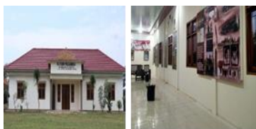
Gambar: Museum Perjuangan

Kehadiran museum ini bisa menjadi mengingatkan masyarakat desa akan sejarah tempat tinggal mereka. dan untuk menarik minat anak muda memperdalam sejarah, data-data yang dikumpulkan melalui sejarawan lokal disajikan dalam bentuk infografis dan desain tata ruang. Foto-foto kepala Desa Rejoagung yang pertama hingga saat ini dan para pahlawan desa menjadi salah satu koleksi dalam museum tersebut.