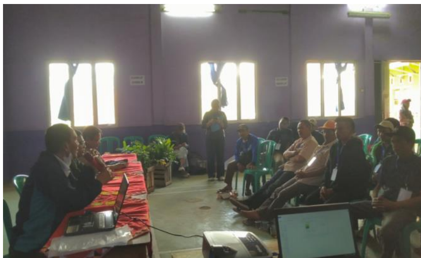
Gambar 2. Penyuluhan Tentang Inovasi Teknik Site Clone Matching Melalui Pemilihan Klon Lokal Unggul dan Klon Nasional (Korola 1, 2, 3, Dan 4) Sebagai Bahan Entres++ yang Disesuaikan Dengan Kondisi Lahan Dalam Mengatasi Kegagalan Panen Pada Saat Cuaca Ekstrem.

yang disarankan dan diberikan oleh Tim PKM Universitas Lampung adalah pupuk kompos, serta pupuk kimia berupa pupuk phonska 15-15-15 yang dapat membantu dalam pertumbuhan, merangsang pematangan, dan produktivitas yang lebih tinggi.