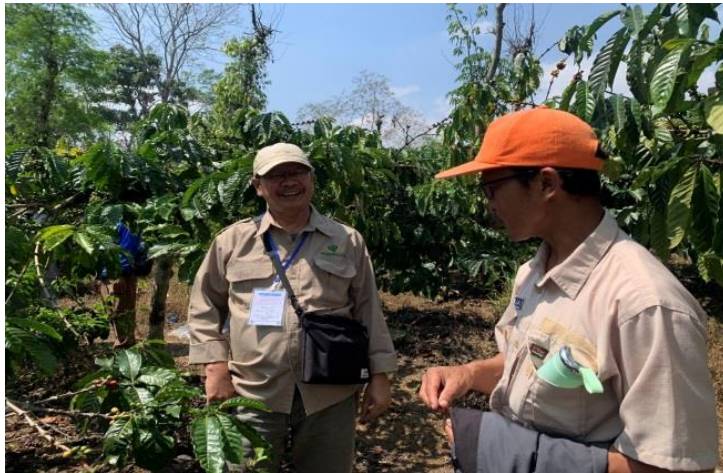
Gambar 6. Pendampingan Pemilihan Jenis Tanaman Pengisi Agroforestri Kopi

dan berkualitas, dan juga sesuai dengan keinginan peserta (petani kopi). Dari aktivitas ini peserta (petani-kopi) mengetahui dan memiliki keterampilan dalam melakukan pemilihan jenis tanaman yang unggul untuk mereka tanam di lahan agroforestri kopi. Penjelasan dan kegiatan pendampingan tentang pemilihan jenis tanaman pengisi agroforestri kopi oleh Tim Universitas Lampung disajikan pada Gambar 6.