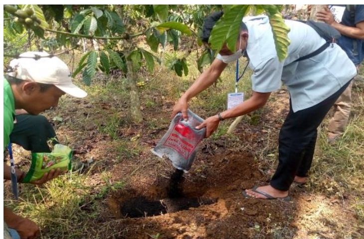
Gambar 5. Praktik Adaptasi Berkebun Kopi Dalam Cuaca Ekstrem

Kegiatan pelatihan selanjutnya yaitu praktik dalam adaptasi berkebun kopi dalam cuaca ekstrem dengan mempraktikkan kepada peserta teknik pemupukan dengan tiga tahap: (1) menggali tanah dengan kedalaman sekitar \pm 20 cm; (2) pupuk dimasukkan ke dalam tanah; dan (3) menutup lubang kembali. Selanjutnya, peserta melakukan kegiatan pemupukan secara mandiri pada empat lokasi kegiatan. Selain itu, petani juga menerima pupuk phonska dan pupuk kompos sebagai alternatif dalam menghadapi cuaca ekstrem. Kombinasi dua pupuk organik-anorganik ini dilakukan untuk memperoleh kombinasi pupuk berimbang dimana pupuk organik yang digunakan untuk meningkatkan kualitas tanah, sedangkan pupuk kimia berperan sebagai booster produktivitas tanaman secara cepat. Dengan kombinasi pupuk ini diharapkan dapat menjawab permasalahan petani dalam kondisi tanah yang mulai menurun kesuburannya dan juga produktivitas kopi yang mulai turun. Praktik adaptasi berkebun kopi dalam cuaca ekstrem telah dilakukan oleh peserta pelatihan seperti diperlihatkan pada Gambar 5.