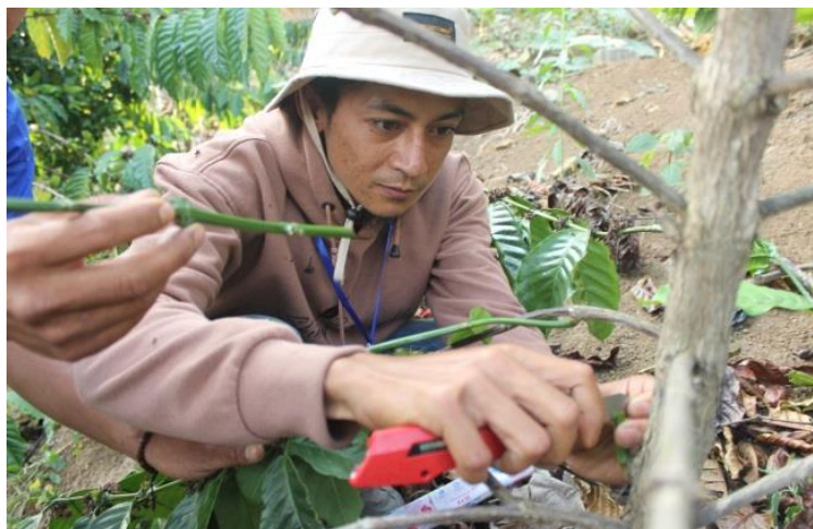
Gambar 4. Praktik Grafting oleh Peserta Pelatihan

Kegiatan pelatihan selanjutnya yaitu praktik dalam adaptasi berkebun kopi dalam cuaca ekstrem dengan mempraktikkan kepada peserta teknik pemupukan dengan tiga tahap: (1) menggali tanah dengan kedalaman sekitar \pm 20 cm; (2) pupuk dimasukkan ke dalam tanah; dan (3) menutup lubang kembali. Selanjutnya, peserta melakukan kegiatan pemupukan secara mandiri pada empat lokasi kegiatan. Selain itu, petani juga menerima pupuk phonska dan pupuk kompos sebagai alternatif dalam menghadapi cuaca ekstrem. Kombinasi dua pupuk organik-anorganik ini dilakukan untuk memperoleh kombinasi pupuk berimbang dimana pupuk organik yang digunakan untuk meningkatkan kualitas tanah, sedangkan pupuk kimia berperan sebagai booster produktivitas tanaman secara cepat. Dengan kombinasi pupuk ini diharapkan dapat menjawab permasalahan petani dalam kondisi tanah yang mulai menurun kesuburannya dan juga produktivitas kopi yang mulai turun. Praktik adaptasi berkebun kopi dalam cuaca ekstrem telah dilakukan oleh peserta pelatihan seperti diperlihatkan pada Gambar 5.