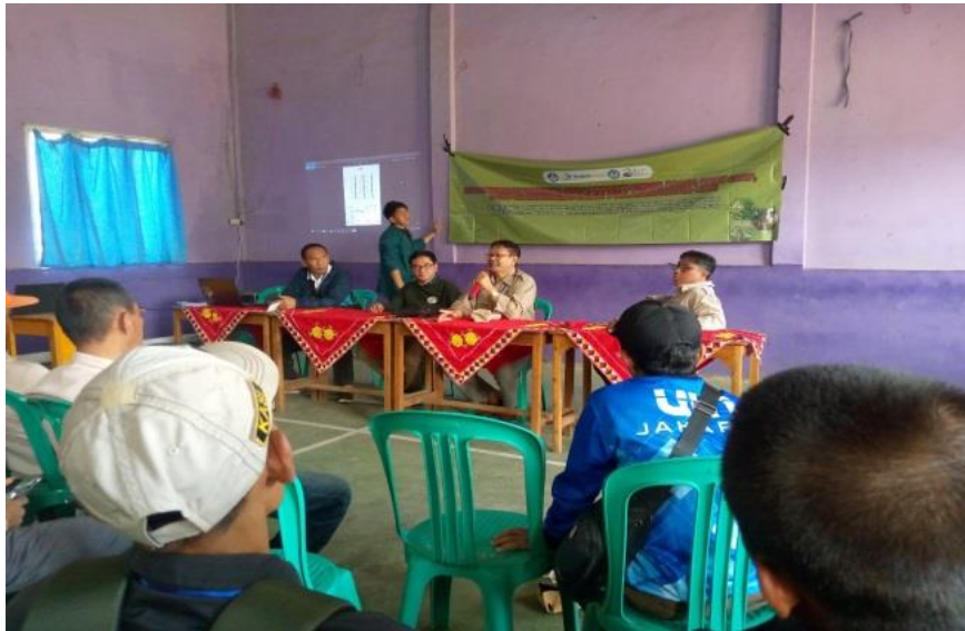
Gambar 3. Penyuluhan Inovasi Teknik Diversifikasi Tanaman Melalui Pengaturan Pola Tanam Agroforestri Kopi Sebagai "Role Model" Dalam Meningkatkan Kesejahteraan Petani Agroforestri Kopi.

diberikan materi dan diskusi, kegiatan ini juga dilakukan dalam bentuk pendampingan untuk melihat kondisi tanaman pengisi, pagar, cash crop , dan pohon penaung yang sudah ada di lahan petani untuk kemudian di evaluasi pertumbuhan tanaman tersebut terhadap kesesuaian lahan. Kemudian diperkenalkan jenis tanaman pengisi, pagar, cash crop dan pohon penaung dengan jenis yang sama, akan tetapi memiliki varietas yang unggul.