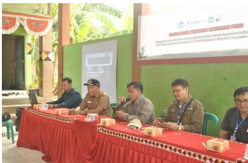
Gambar 1. Sosialisasi Kegiatan PKM oleh Tim PKM Universitas Lampung