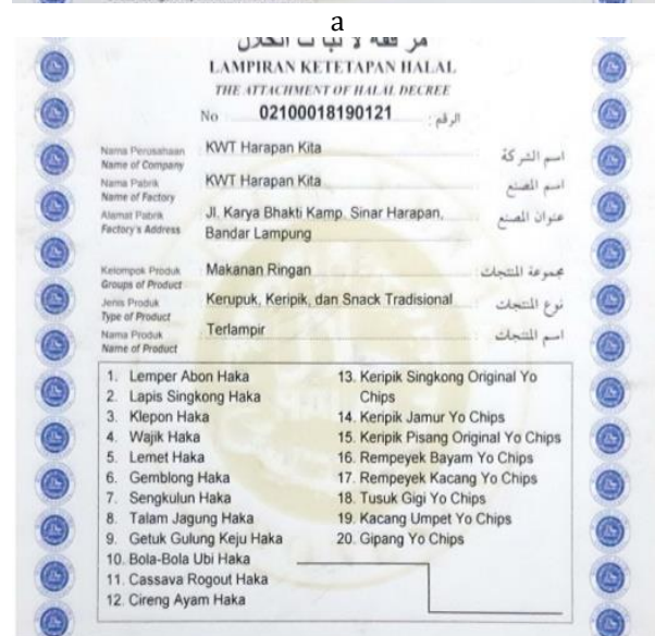
Gambar 5 a dan b) Sertifikat halal produk Kelompok Wanita Tani Harapan Kita.