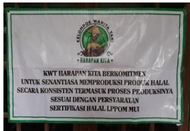
Gambar 4 Salah satu banner yang dipasang di salah satu rumah produksi Kelompok Wanita Tani Harapan Kita.

sudah terdaftar di LPPOM MUI dengan Nomor SH 02100018190121 (Gambar 5).