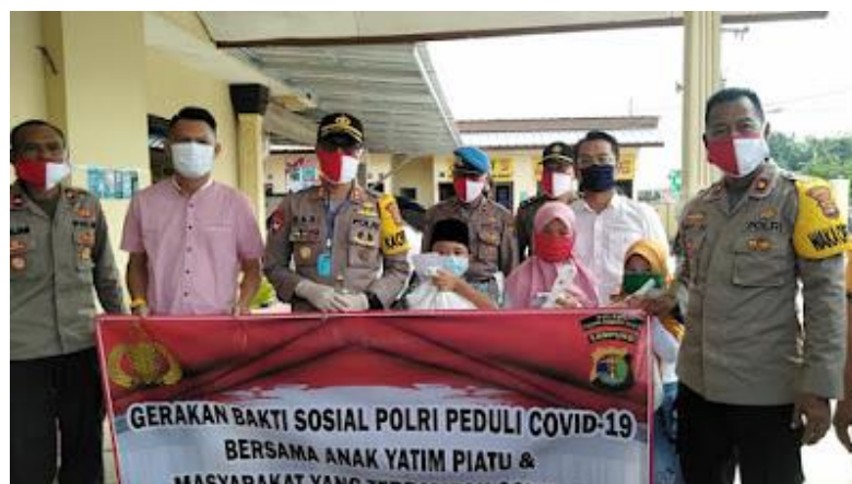
Gambar 4. Polres Tubaba dan PT. HIM Berikan Bantuan Kepada Ratusan Anak Yatim Piatu

Oleh karenanya perusahaan diharapkan dapat optimal juga dalam pemberian sebuah Implementasi CSR, terkhususnya CSR yang dapat memberdaya masyarakat. Proses ini diharapkan mampu memberikan uluran sosial dan meningkatkan perekonomian warga agar warga dapat mendapatkan sosial ekonomi yang lebih layak (Bambang Tri Kurniawan, 2017). Apalagi wujud dari implementasi CSR yang ada di perusahaan sudah tidak terindikasi dilaksanakan dengan baik lagi. Seperti Sunatan massal, donor darah, beasiswa dan renovasi gedung sudah tidak terimplementasi dengan baik dari perusahaan kepada masyarakat. Saat ini perusahaan hanya sebatas memberikan dana kepedulian atau dana bantuan bahkan dana tunjangan hari raya saja yang dilakukan baik kepada masyarakat atau kepada pihak khusus seperti anak yatim. Hal ini pun dilakukan perusahaan yang berkolaborasi dengan kepolisian yang ada di Kabupaten Tulang Bawang Barat. Hal ini pun dilakukan beriringan kembali dengan terjadinya sebuah pandemi covid 19 lalu, sehingga perusahaan memberikan santunan kepada anak yatim atau pihak masyarakat.