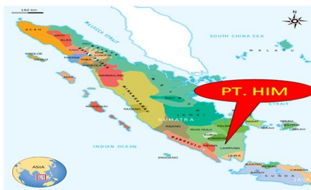
Gambar 1. Lokasi PT Huma Indah Mekar dari Peta Sumatera.

Perusahaan perkebunan karet yang ada di Kabupaten Tulang Bawang Barat bernama PT Huma Indah Mekar ini adalah salah satu perusahaan karet terbesar yang ada di Provinsi Lampung. PT Huma Indah Mekar merupakan salah satu jenis perusahaan swasta nasional yang bergerak pada bidang perkebunan yaitu karet, dan pengolahannya bertempat di Desa Penumangan Baru, Kecamatan Tulang Bawang Tengah, Kabupaten Tulang Bawang Barat Lampung, yang mana PT Huma Indah Mekar dapat dilihat pada titik koordinat 4^{\circ}28'52.63'' LS dan 105^{\circ}08'26.26'' BT. PT Huma Indah Mekar, menjadi salah satu perusahaan grup, dimana perusahaan ini memiliki kantor pusat yang beralamatkan di Kompleks Rasuna Epicentrum, Bakrie Tower Lt 18 dan 19, Jl. H. R. Rasuna Said, Jakarta. Berikut pada Gambar 1. Lokasi PT Huma Indah Mekar yang dilihat dari peta wilayah Sumatera.