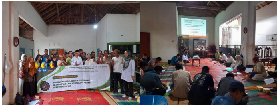
Gambar 5. Peserta pelatihan Gapoktan Cahaya Baru Desa Sukadana Baru Kecamatan Margatiga Kabupaten Lampung Timur.

Oleh sebab itu, diharapkan program pembinaan kepada Gapoktan Cahaya baru oleh tim pengabdian kepada masyarakat Jurusan Agribisnis Universitas Lampung dapat terus berlanjut, sehingga program selanjutnya tim dapat memberikan pendampingan dan pelatihan secara lebih intensif dan pada akhirnya dapat mengoptimalkan modal social dan pengautan kelembagaan Gapoktan Cahaya Baru Desa Sukadana Baru Kecamatan Margatiga Kabupaten Lampung Timur.