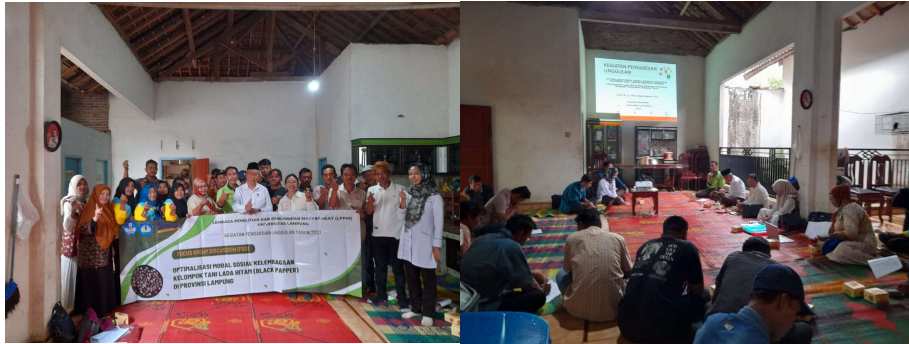
Gambar 5. Peserta pelatihan Gapoktan Cahaya Baru Desa Sukadana Baru Kecamatan Margatiga Kabupaten Lampung Timur.

tersebut, kegiatan penyuluhan memberikan dampak positif terhadap pengetahuan peserta mengenai modal social dan penguatan kelembagaan petani . Hal tersebut terbukti dari nilai rata-rata hasil post-test yang meningkat pada semua bidang materi.