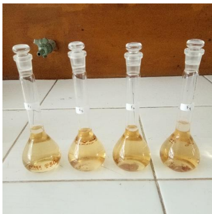
Gambar 1. Kejernihan warna sampel parfum cengkeh. Urutan kiri ke kanan: A1B1, A1B2, A2B1, dan A2B2.

Sampel parfum pada penelitian memiliki rona kuning kecoklatan akibat penambahan minyak cengkeh yang memiliki rona coklat kemerahan yang sangat pekat (Hadi, 2012). Oleh karena itu, bila minyak cengkeh ditambahkan baik dalam jumlah sedikit maupun banyak, larutan akan tetap berwarna kecoklatan. Komposisi antara top – middle – based notes dengan pelarut ini yang menghasilkan warna dan kejernihan parfum disukai banyak panelis. Secara keseluruhan hasil dari perlakuan parfum memiliki warna kuning kecoklatan namun jernih karena menggunakan pelarut ( absolute ), seperti yang tersaji pada Gambar 1.