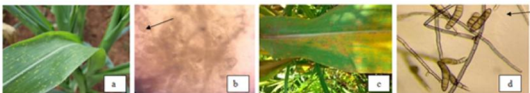
Gambar 2. (a) gejala karat daun, (b) Konidia Puccinia sorghi , (c) Gejala hawar daun, (d) Konidia Helminthosporium.

Helminthosporium turcicum mempunyai konidiofor tegak dan kuat, berwarna coklat. Konidium seperti kumparan atau seperti gada panjang, sering agak bengkok, bersekat banyak berwarna coklat dan berdingding tebal (Gambar 2d). Pengamatan pada minggu ke-4 sampai minggu ke-8 menunjukkan bahwa perlakuan P. fluorescens dan P. polomyxa mampu mengurangi keparahan penyakit hawar daun jagung manis dibandingkan perlakuan kontrol. Perkembangan keparahan penyakit hawar daun jagung manis pada masing-masing perlakuan P. fluorescens , P. polomyxa sertacampuran P. fluorescens dan P. polomyxa setiap minggunya menunjukkan peningkatan. Pada minggu ke-8 keparahan penyakit hawar daun rata-rata tertinggi pada perlakuan kontrol yaitu mencapai 18,70% sedangkan persentase keparahan penyakit hawar daun