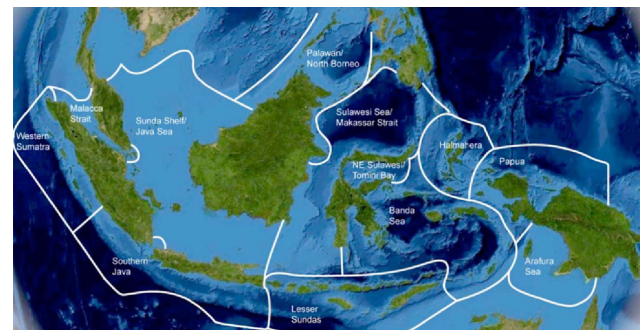
Gambar 2. Sketsa menunjukkan dua belas ekoregion laut Indonesia sebagaimana didefinisikan dalam skema klasifikasi Marine Ecoregions of the World (MEOW) (Huffard, et.al digambar ulang dari Spalding et al., 2007).

Potensi lestari sumberdaya perikanan laut Indonesia kurang lebih 6,4 juta ton per tahun, terdiri dari: ikan pelagis besar (1,16 juta ton), pelagis kecil (3,6 juta ton), demersal (1,36 juta ton), udang penaeid (0,094 juta ton), lobster (0,004 juta ton), cumi-cumi (0,028 juta ton), dan ikan-ikan karang konsumsi (0,14 juta ton). Dari potensi tersebut jumlah tangkapan yang dibolehkan (JTB) sebanyak 5,12 juta ton per tahun, atau sekitar 80% dari potensi lestari. Potensi sumberdaya ikan ini tersebar di 9 (sembilan) wilayah Pengelolaan Perikanan Indonesia (Lasabuda, 2013).