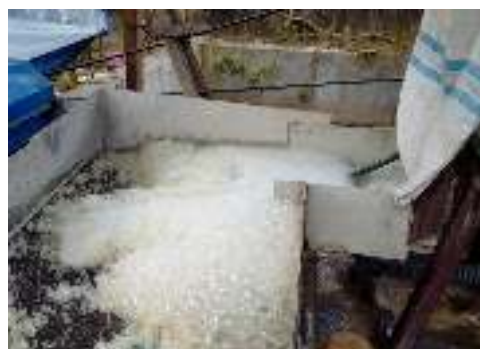
Gambar 4. Cacahan atau biji plastik yang dihasilkan pengelola limbah plastic

Dari hasil evaluasi, peningkatan pengetahuan para peserta mengenai proses pengelolaan sampah plastik dan ketrampilan dalam menggunakan bantuan alat yang diberikan secara signifikan dapat meningkat. Pemberian bantuan alat centrifugal dryer kepada kelompok pengelola limbah plastik, dapat membantu proses pengolahan sampah plastik di lingkungan masyarakat sekitar Jati Agung. Kegiatan ini juga memberikan nilai tambah secara ekonomi pada sampah plastik yang dikelola oleh mitra dan kegiatan pengabdian ini dapat memberikan keuntungan kepada masyarakat serta dapat memberikan peningkatan ekonomi bagi mitra khususnya yaitu kelompok pengelola sampah plastik di Sumber Jaya, Jati Agung, Lampung Selatan.