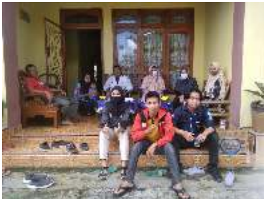
Kegiatan pengabdian melibatkan mahasiswa baik dalam tahap sosialisasi maupun saat pelatihan dan praktek alat pengering.