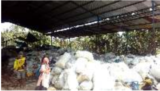
Gambar 1. Sampah plastik yang menumpuk

kemampuan masyarakat dalam mengolah sampah plastik secara mandiri.