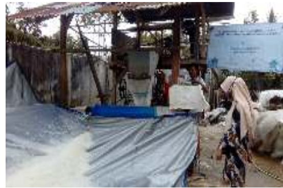
Gambar 3. Anggota mitra sedang mengoperasikan alat pengering.

Alat pengering yang diberikan kepada mitra memiliki kapasitas cacahan plastik maksimum 100 kg dan hasil pengeringan kadar air cacahan plastik berkurang hingga 80%. Hasil pengeringan cacahan plastik ini terlihat seperti terlihat pada Gambar 4.