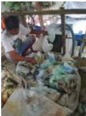
Gambar 2. Anggota Monaco Rongsok sedang memilah plastic

Sesuai dengan karakteristik plastik yaitu polimer yang strukturnya permanen, plastik-plastik yang sudah tidak dapat dipergunakan lagi memerlukan waktu yang lama untuk penguraiannya. Plastik memerlukan waktu kira-kira sampai delapan puluh tahun lamanya untuk diuraikan, kandungan yang terdapat pada plastik yaitu material-material berbahaya seperti logam berat (timbel dan nikel), apabila plastik terurai tentu pastinya zat-zat berbahaya juga akan tercampur ke dalam tanah dan masuk ke dalam air tanah sehingga menyebabkan polusi pada tanah dan air. Karakteristik plastik yang lama untuk terurai, maka sampah-sampah plastik dimanfaatkan dengan didaur ulang menjadi barang yang berguna untuk dapat digunakan kembali (Aprizal, 2018).