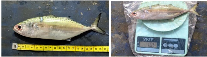
Gambar 1. Pengukuran panjang dan berat ikan kembung lelaki di PPP Lempasing