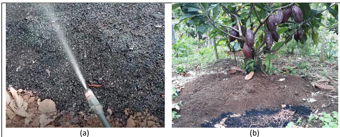
Gambar 2. Pencampuran pupuk pada biochar (a) disemprot larutan pupuk, (b) dicampur ketika aplikasi

Hasilnya menunjukkan bahwa inklusi campuran kultur bakteri dalam kombinasi dengan biochar adalah strategi yang menjanjikan untuk meningkatkan hasil gabah, meningkatkan efisiensi penggunaan dan mengurangi tingkat aplikasi pupuk NPK anorganik yang direkomendasikan untuk budidaya jagung di zona agroekologi sabana pesisir Ghana.