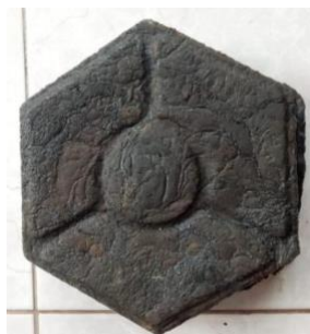
Gambar 3 Paving Block Komposisi Limbah Plastik, Oli Bekas dan Pasir

Pembuatan paving block ini menggunakan ukuran 1,5 kg plastik, 150 ml oli bekas dan 0,5 kg pasir. Pertama, melelehkan limbah plastik sedikit demi sedikit ke dalam kaleng. Kemudian setelah meleleh sempurna dimasukkan 0,5 kg pasir yang telah diayak sebelumnya. Kemudian ditambahkan oli bekas sebanyak 150 ml, aduk hingga rata. Setelah adonan merata lalu di dimasukkan ke dalam cetakan. Tunggu hingga adonan kering dan dikeluarkan dari cetakan. Hasilnya diperoleh satu buah paving block dengan berat 1,4 kg. dari kedua paving block pasir dan sekam. Pasir termasuk yang kurang mulus dan terlihat adonan pasir warna coklat sedikit. Analisis hasil kekuatan fisik paving block sampel yang telah dibuat disajikan dalam Tabel 1.