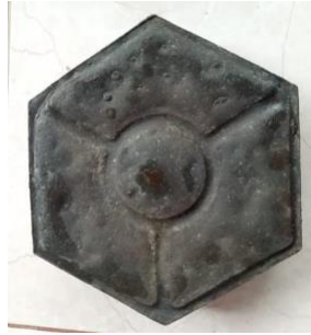
Gambar 1 Paving Block Segi Enam Komposisi Plastik dan Oli Bekas