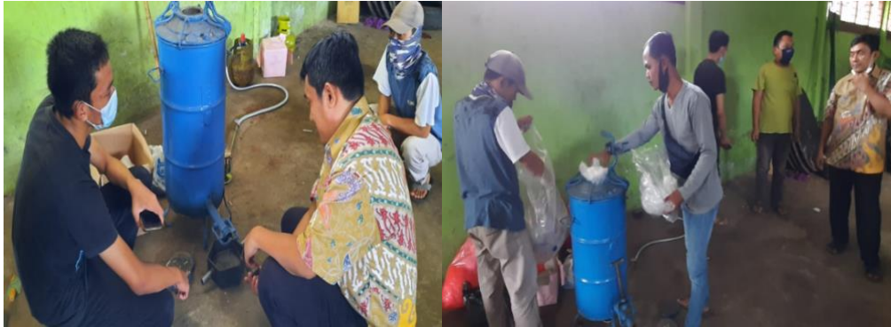
Gambar 4. Foto-foto Kegiatan Proses Pembuatan Paving Blok