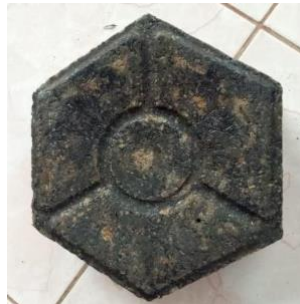
Gambar 2 Paving Block Segi Enam Komposisi Limbah Plastik, Oli Bekas dan Sekam Padi

Pembuatan paving block ini menggunakan ukuran 1,5 kg plastik, 150 ml oli bekas dan 0,4 kg sekam padi. Pertama, dilelehkan limbah plastik sedikit demi sedikit ke dalam kaleng. Kemudian setelah meleleh sempurna dimasukkan oli bekas sebanyak 150 ml, aduk hingga rata. Selanjutnya masukkan sekam padi sedikit demi sedikit aduk hingga merata. Setelah adonan merata lalu di dimasukkan ke dalam cetakan. Tunggu hingga adonan kering dan dikeluarkan dari cetakan. Hasilnya diperoleh satu buah paving block dengan berat 0,85 kg. Permukaan sedikit mulus dari paving sekam dan lebih ringan dari kedua paving block lainnya dan terlihat sekam padinya dipermukaan paving block.