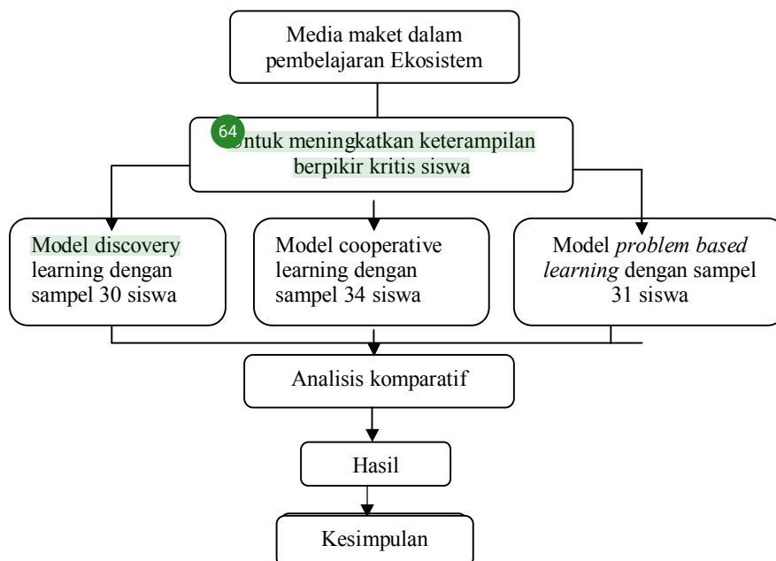
Gambar 1. Alur penelitian

Metode yang digunakan adalah kuasi eksperimental dengan desain kelompok pembandingan non-ekuivalen, yaitu kajian untuk menyelidiki hubungan antara suatu variabel terhadap variabel lainnya dengan mengkaji perbedaan peranan variabel bebas terhadap variabel tak bebas pada kelompok yang berbeda (McMillan dan Schumacher, 2001). Dalam hal ini dilakukan analisis terhadap pengaruh penggunaan media maket dalam tiga macam pembelajaran berbasis konstruktivisme ( model discovery learning , model cooperative learning , dan model problem based learning ) terhadap keterampilan berpikir kritis siswa. Untuk jelasnya, alur penelitian digambarkan sebagai berikut: