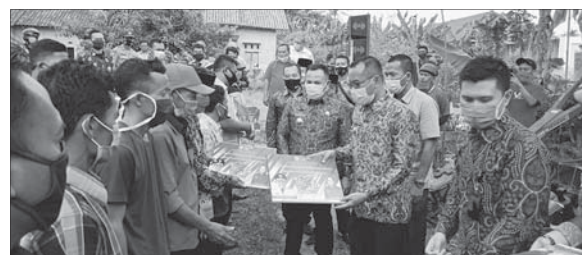
SERAHKAN BANTUAN Bupati Lamsel Nanang Ermanto memberikan bantuan alsintan kepada 11 poktan di Kecamatan Candipuro.

Bupati Nanang Ermanto mengatakan, dengan diterimanya alsintan tersebut, diharapkan dapat dimanfaatkan dengan maksimal oleh para petani. Sehingga petani di Lamsel dapat meningkatkan hasil produksi pertaniannya. "Saya minta alsintan ini dijaga dan dirawat dengan baik. Supaya mesin pertanian ini bisa tahan lama. Manfaatkan dan gunakan secara bergotong royong bersama para petani di kelompoknya. Jangan pertanian," katanya. (rls/c1/nca)