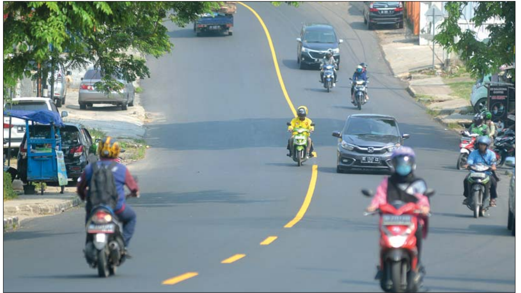
SELESAI DIBENAH: Pengendara melintasi marka jalan yang baru dicat di Jalan Wolter Monginsidi, Gulak-Galik, Telukbetung Utara, Bandar Lampung, Kamis (17/9).