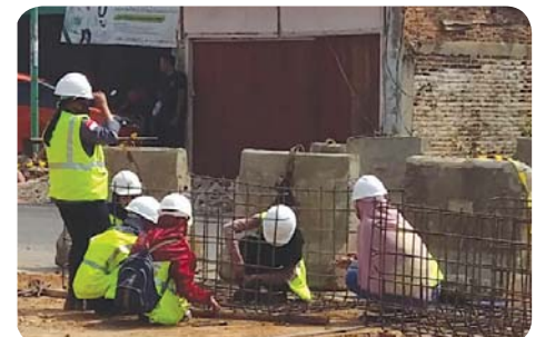
Aktivitas mahasiswa PKL pada pembangunan Flyover di Jalan Sultan Agung.

"Sebagai mahasiswa kampus swasta terbaik di Lampung, tentunya mahasiswa kita akan melakukan yang terbaik, dan menjaga nama baik Universitas Teknokrat Indonesia. PKL ini sangat penting, sehingga mahasiswa bisa menerapkan ilmu yang didapatkan dari kampus langsung dan bisa dipraktikkan di tempat mereka PKL," pungkasnya. (*)