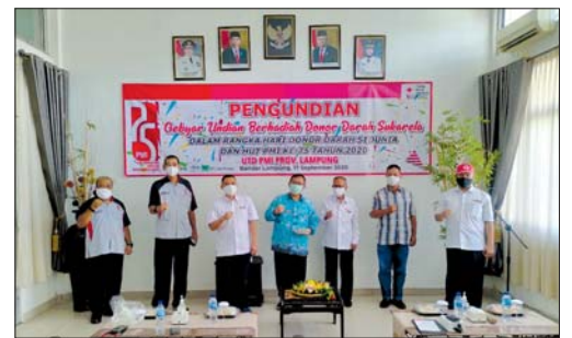
PUNCAK GEBYAR: UTD PMI Lampung memotong tumpeng sekaligus mengundi Gebyar Undian Berhadiah Pendonor Darah Sukarela dari para dermawan darah, Kamis (17/9).