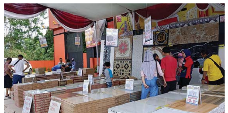
MURAH: Mitra Bangunan Supermarket (MBS) di Jl. Hajimena No. 88, Natar, Lampung Selatan, menggelar Bazar Murah dengan diskon hingga 60 persen.