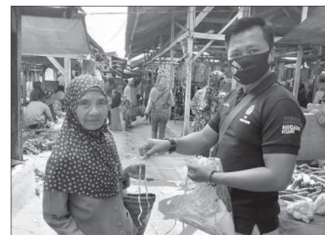
FOTO HERMANSYAH/RADAR LAMPUNG EDUKASI: Petugas PPK Rebangtangkas, Waykanan, mendukasi masyarakat di pasar.

"Kami targetkan partisipasi pemilih mencapai 80 persen.