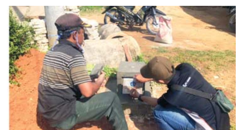
JAMIN KEPASTIAN: Pembuatan salah satu batas desa/pekon Sukoharjo I, Sukoharjo, Pringsewu, dengan metode survei GNSS belum lama ini.