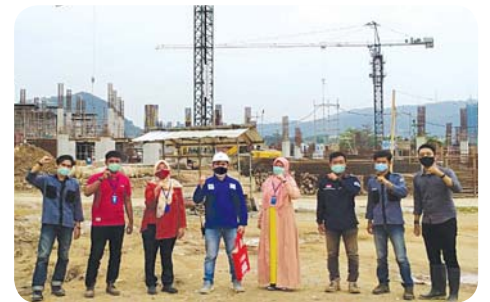
Kunjungan lapangan proyek Lampung City Superblok.