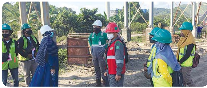
Kunjungan mahasiswa PKL Teknokrat ke PLTU Sebalang.

pelaksanaan PKL ini mahasiswa ditempatkan di proyek-proyek pembangunan sarana dan prasarana mencakup pembangunan bendungan Margatiga, embung Pringsewu, flyover pada Jalan Sultan Agung, PLTU Sebalang, PDAM Cisdane, dan pembangunan kantor pada area Pelabuhan Panjang. Tidak hanya itu mahasiswa Teknik Sipil Universitas Teknokrat Indonesia juga melaksanakan PKL di mega proyek komersial yang mencakup pembangunan area apartemen dan Mall Bandar Lampung pada proyek Lampung City Superblok.