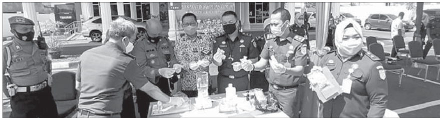
MUSNAHKAN BARANG BUKTI Kejari Bandar Lampung memusnahkan barang bukti narkoba dari 359 perkara yang telah berkekuatan hukum di kantor kejari, Kamis (17/9). Yaitu berupa 109,98 gram sabu, 1.307,20 gram ganja, 194,97 gram ekstasi, dan beberapa kosmetik ilegal.