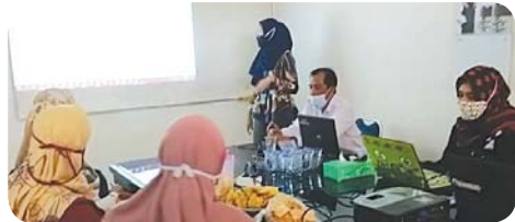
Presentasi mahasiswa PKL Danau Situ dan Embung BBWS Mesuji Sekampung.