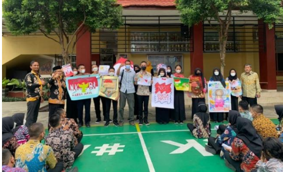
Gambar 4. Kegiatan Pengabdian

bahwa sekolah adalah sebuah lembaga pendidikan yang memiliki potensi cukup besar dalam membantu pemerintah dalam meneguhkan komitmen kebangsaan.