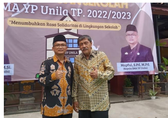
Gambar 1. Kegiatan Pengabdian

telah dibuat berdasarkan Undang-Undang Dasar Negara Republik Indonesia Tahun 1945, dan melakukan kontrol pelaksanaan Undang-Undang Dasar Negara Republik Indonesia Tahun 1945 baik dalam bentuk Peraturan Perundang Undangan, kebijakan, maupun tindakan penyelenggara negara. Dalam perspektif ini, maka para pelajar SMA di Kota Bandar Lampung harus menjamin bahwa dalam dinamika kehidupan sehari-hari di lingkungan sekolah tidak ada kemungkinan atau tidak akan berpotensi memunculkan bibit-bibit penolakan atas substansi konstitusi.