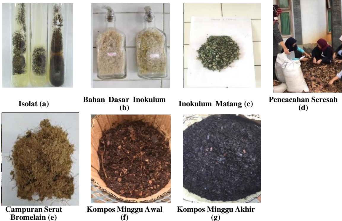
Gambar 2. Proses pengomposan

Hasil yang diperoleh dapat diketahui melalui evaluasi terhadap peserta pelatihan. Evaluasi bertujuan untuk mengumpulkan data baik pada saat proses sampai hasil yang telah dicapai melalui kegiatan pelatihan. Evaluasi ini untuk mendapatkan masukan yang dapat dijadikan dasar untuk kegiatan lanjutan yang akan dilaksanakan. Evaluasi dalam kegiatan ini dilakukan dalam tiga tahap, yaitu di awal melalui pre-test , pada saat proses ceramah melalui diskusi dan pelatihan disertai dengan tanya jawab, dan di akhir kegiatan melalui post-test .