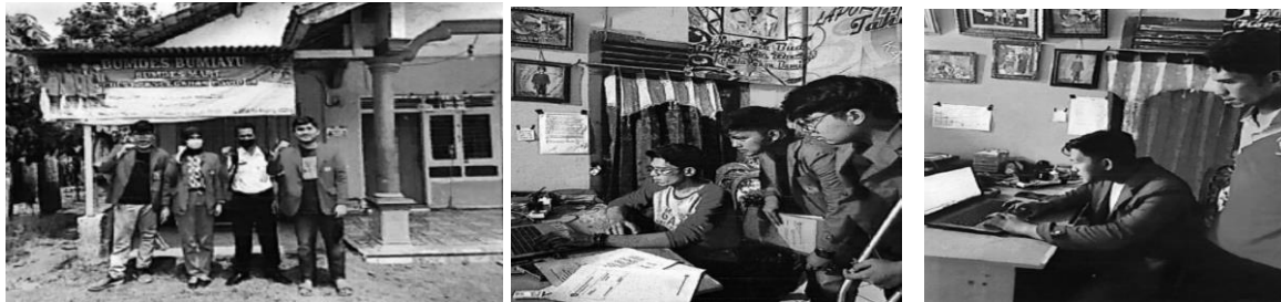
Gambar 2. Observasi Tim PKM ke BUMDES Bumi Ayu kanaka (a) di luar BUMDES (b) dan (c) di dalam ruangan bersama pengurus BUMDES

Prinsip Condition (kondisi) dinilai tidak terlalu berarti oleh BUMDes Bumiayu Kanaka, pada hal ini mereka tidak melihat kondisi perekonomian calon debitur karena prinsip karakter merupakan hal yang paling dianggap keberartiannya oleh BUMDes Bumiayu Kanaka sehingga prinsip condition diabaikan untuk pemberian pinjaman dana.