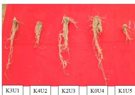
Gambar 2. Intensitas Serangan Phytophthora sp. pada Akar Tanaman Nanas

intensitas serangan Phytophthora sp. pada seluruh pengamatan (13 MST, 15 MST, 18 MST, 20 MST) secara nyata mampu menekan serangan Phytophthora sp. Hal tersebut diduga karena suspensi MOL mengandung mikroba yang bermanfaat yang mampu menghambat serangan patogen.