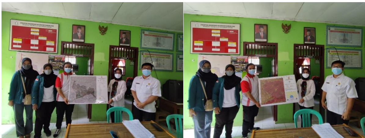
Gambar 3. Penyerahan peta administrasi dan peta rawan banjir Kelurahan Gunung Mas