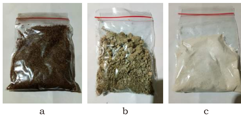
Gambar 1. Penampakan visual bahan selulosa yang digunakan (a) serbuk selulosa, (b) selulosa onggok, dan (c) CMC

Bahan yang digunakan dalam penelitian ini meliputi karet SIR 20 yang diperoleh dari supplier lokal, serbuk kasar selulosa dari serat tandan kosong kelapa sawit ( \text{BM} = 226.697,4 \text{ g/mol} ), selulosa onggok dari limbah pati singkong ( \text{BM} \approx 243.000 \text{ g/mol} ), CMC dari supplier lokal ( \text{BM} = 264,204 \text{ g/mol} ), serta bahan kimia komponding karet kualitas teknis dari supplier lokal. Adapun bahan kimia komponding karet meliputi: sulfur, asam stearat, seng oksida, bahan penyambung hexamine ( hexamethylenetetramine ) /resorcinol (1,3-isomer dari benzenediol ) dan anhidrida maleat, bahan pencepat CBS ( cyclohexyl benzothiazole sulfenamide ), antioksidan TMQ ( trimethyl dihydroquinoline ), serta bahan pelunak gliserol. Gambar untuk serbuk selulosa, selulosa onggok, dan CMC disajikan dalam Gambar 1.