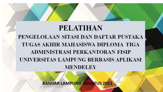
Gambar 1. Flyer Kegiatan