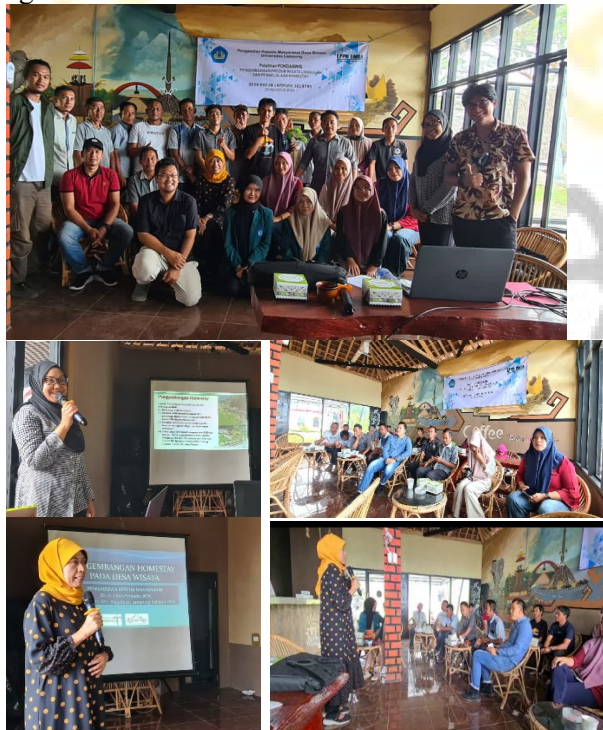
Gambar 7. Penyuluhan Homestay (atas) dan Pelatihan Sadar Wisata (bawah) (Tim Pengabdian, 2022)

Tahapan terakhir dalam kegiatan pengabdian kepada masyarakat ini adalah Penyiapan SDM Desa Kunjir dengan Pelatihan Sadar Wisata Dan Penyuluhan Homestay . Dalam kegiatan ini tim pengabdian memberikan bantuan berupa dana untuk pengadaan papan penamaan atau tanda homestay pada beberapa homestay . Hal ini dilakukan untuk membantu POKDARWIS dalam meningkatkan pelayanan serta melakukan branding pada homestay agar dikenal oleh wisatawan.