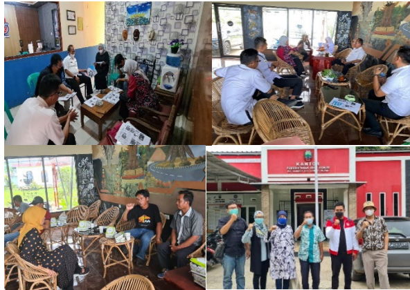
Gambar 1. Tahapan Sosialisasi dan FGD ( focus group discussion ) dengan stakeholder

diperoleh informasi jika selama ini terdapat paket wisata yang telah bekerja sama dengan pihak travel agen namun tidak berdampak langsung pada pendapatan Desa Kunjir. Hasil temuan ini menjadi penguat bahwa potensi Desa Kunjir dalam mengelola destinasi wisata serta fasilitas pendukung wisata dirasa belum cukup dikenali oleh pelaku usaha wisata.