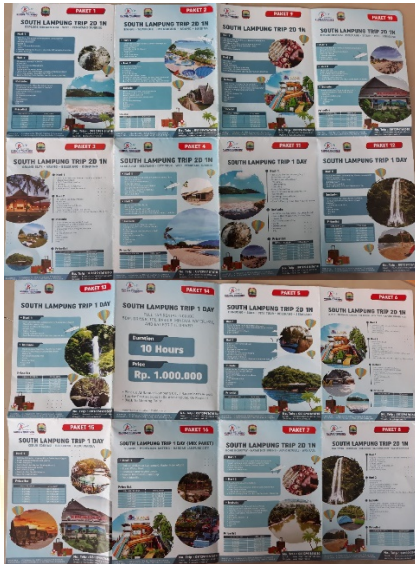
Gambar 4. Produk atau paket wisata yang ada belum memasukkan Desa Kunjir sebagai salah satu destinasi (Tim Pengabdian, 2022)