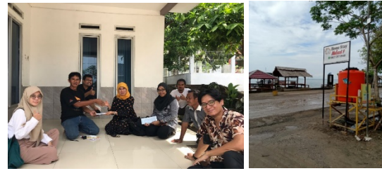
Gambar 8. bantuan pengadaan papan tanda homestay Desa Kunjir. (Tim Pengabdian, 2022)