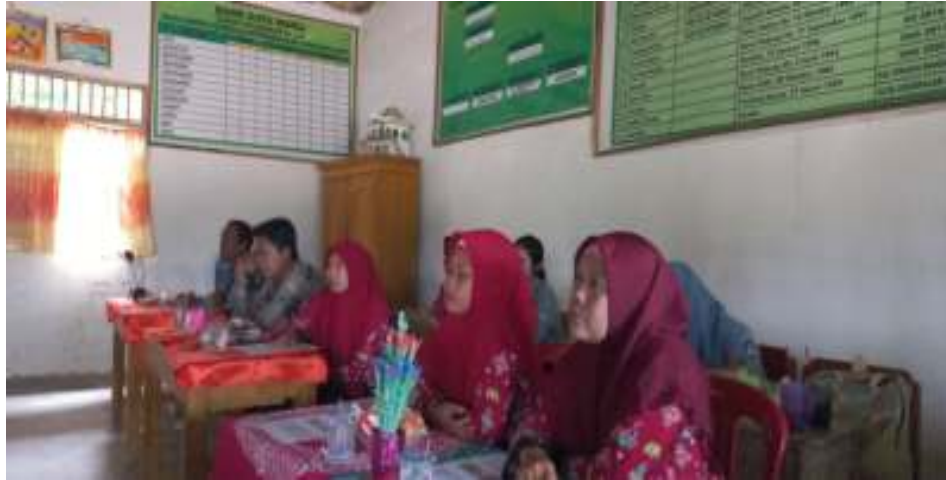
Gambar 2. Antusias guru menyimak dengan serius.

program Kampus Merdeka. Program ini menurut mereka sangat baik dan bermanfaat bagi sekolah, apalagi bagi sekolah yang tergolong sebagai daerah 3T. Sekolah yang minim fasilitas dan sumberdaya manusia.