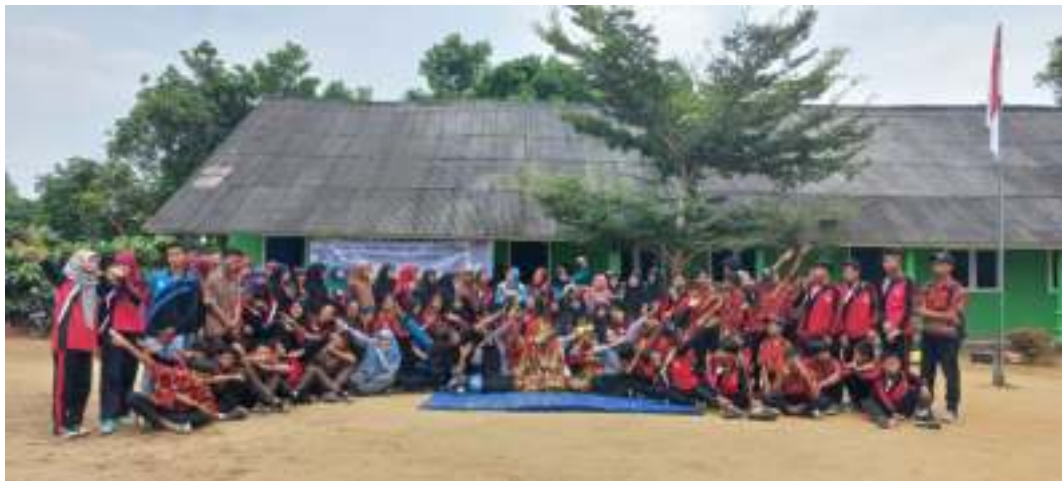
Gambar 1. Foto bersama guru dan kepala sekolah serta mahasiswa kampus mengajar