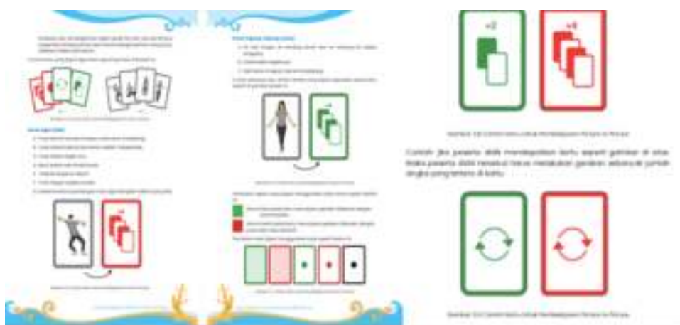
Gambar 4. Kartu sebagai media pembelajaran Literasi dan Numerasi

Selain itu untuk penguatan literasi, siswa dan guru juga dapat membaca tanda yang disajikan dalam gambar. seperti pada gambar berikut ini.