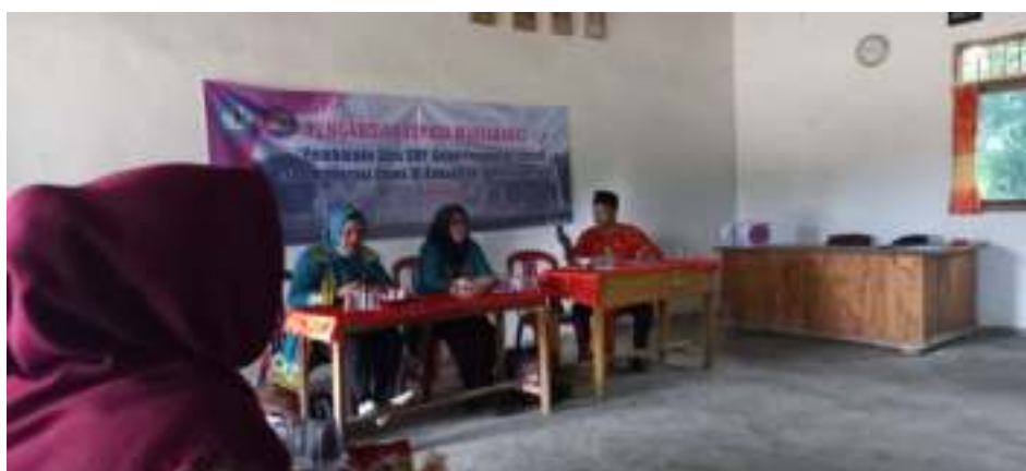
Gambar 1. Penjelasan narasumber tentang literasi dan numerasi.

Pelatihan peningkatan Literasi pada guru-guru berjalan dengan lancar, pada pemberian materi narasumber menyampaikan pentingnya penguatan literasi dan numerasi. Pembelajaran akan sangat menyenangkan jika guru dapat memahami konsep literasi dan numerasi. Pada kesempatan ini beberapa guru tidak hadir karena cuaca yang buruk, sehingga guru yang berasal dari luar kampung atau yang harus melewati jalanan yang rusak dan menyeberangi sungai tidak dapat mengikuti kegiatan. Rata-rata guru yang tidak hadir adalah guru bidang studi yang seharusnya dapat menyimak dan nantinya dapat menerapkan literasi dan numerasi saat pembelajaran di kelas.