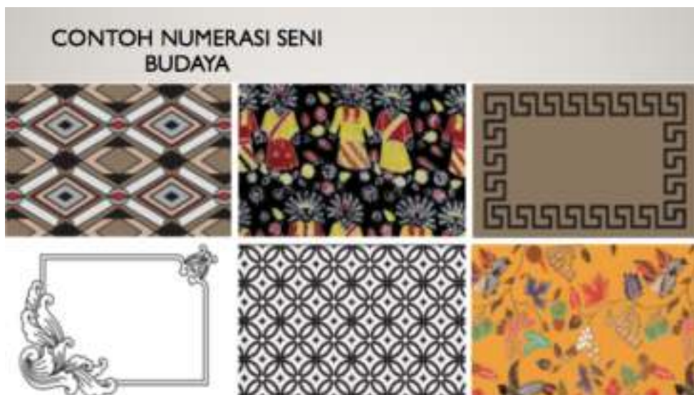
Gambar 3. Contoh literasi dan numerasi pada mata pelajaran seni.

Literasi dan Numerasi tidak hanya diterapkan pada pembelajaran eksak seperti matematika dan Literasi pada bahasa. konsep literasi dan numerasi juga dapat diterapkan melalui pembelajaran seni di sekolah. Berikut ini materi yang diberikan terkait dengan Literasi dan Numerasi di bidang seni terutama pada seni rupa.