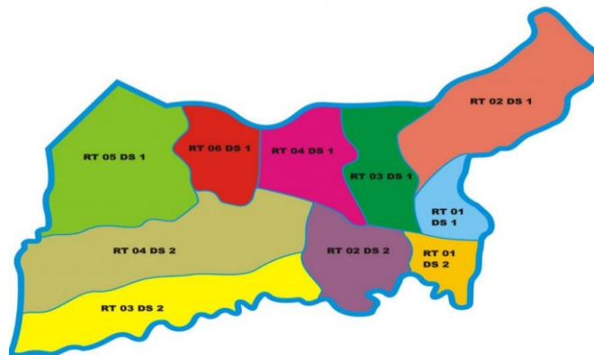
Gambar 1. Peta Desa Rejosari

Dalam menjalankan usaha desa, tentunya 10 diperlukan pengetahuan yang memadai terkait usaha beserta aktifitas yang ada di dalamnya, salah satunya adalah pengelolaan keuangan dan pelaporan keuangan BUMDesa. 9 Pengelolaan keuangan berbasis akuntansi dapat memberikan manfaat bagi pelaku UMKM untuk mengetahui kondisi keuangan usaha secara pasti, mengatur dan mengontrol keseluruhan transaksi keuangan yang terjadi di sepanjang keberlangsungan usahanya. [3] Hal ini menunjukkan bahwa 17 pengelolaan keuangan yang baik berpengaruh pada peningkatan kinerja usaha dan peningkatan daya saing. Sayangnya tidak semua orang mengetahui pengertian dan pentingnya pelaporan keuangan. Akibatnya dalam proses