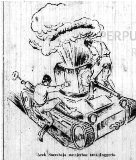
Gambar 1. Surat Kabar Merdeka, 20 November 1945

Kedaulatan Rakjat termasuk pers yang paling bersemangat dalam membela eksistensi kemerdekaan RI serta menyerang pihak Belanda. November 1945 tepatnya pada tanggal 24, surat kabar Kedaulatan Rakjat menyajikan berita berupa ajakan kepada seluruh rakyat Indonesia pada halaman pertamanya yang berisi: “ Saat Bertempoer Soedah datang oentoe k seloeroeh rakjat Indonesia. Taiktik berdiplomasi soedah tidak pada tempatnja lagi ”. ( Kedaulatan Rakjat , 24 November 1945 Hal. 1).