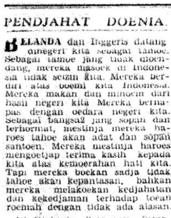
Gambar 4. Surat Kabar Kedaulatan Rakjat, 24 November 1945 Hal. 1 (Sumber: Dinas Perpustakaan dan Arsip Daerah Daerah Istimewa Yogyakarta)

Pers nasional yang bersifat revolusioner beranggapan bahwa mempertahankan kemerdekaan Indonesia dengan cara diplomasi merupakan tindakan yang tidak jantan dan setengah-setengah, serta tidak sesuai dengan perjuangan revolusi dan akan banyak memberikan kesempatan kepada Belanda untuk kembali menguasai Indonesia. Bagi mereka yang berjiwa revolusioner tentu saja pertempuran merupakan jalan yang harus ditempuh sebagai wujud paling kongkret dalam mempertahankan kemerdekaan. Alasannya yaitu karena pers yang bersifat revolusioner, menyaksikan gelora semangat dari badan-badan perjuangan yang ada dan dengan berlandaskan Proklamasi 17 Agustus 1945, sehingga jalan pertempuran dalam mempertahankan kemerdekaan RI itu merupakan keharusan.