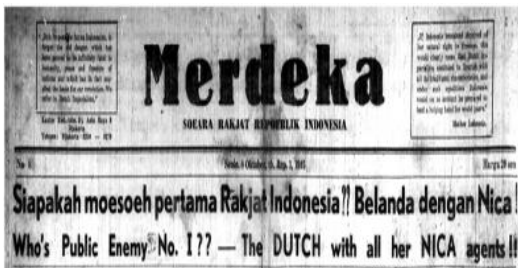
Gambar 2. Surat Kabar Merdeka, 08 Oktober 1945, hal. 1

memiliki tujuan yang sama yaitu sama-sama ingin mempertahankan kemerdekaan Indonesia. Namun memiliki "suara" yang berbeda dalam menanggapi masalah menentukan strategi untuk mempertahankan kemerdekaan Indonesia. Dalam hal ini, faktor tempat dan orientasi ideologi-politik menjadi salah satu penyebab dari adanya perbedaan pandangan, sikap, dan pendirian para redaktur persnya (Suwirta, 2015: 158-159).