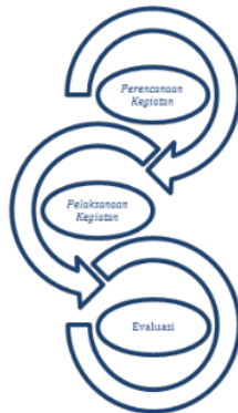
Gambar 2. Diagram rangkaian pelaksanaan kegiatan pelatihan

terhadap kegiatan pelatihan peningkatan keterampilan menulis karya sastra dan ilmiah bagi siswa SMP se-Kota Metro yang diungkapkan melalui kuesioner, dan (2) karya sastra dan karya ilmiah yang telah dikembangkan. Kegiatan pelatihan dinyatakan berhasil apabila minimal 75% peserta merespon positif, dan telah berhasil membuat karya sastra dan karya ilmiah dengan kriteria baik.