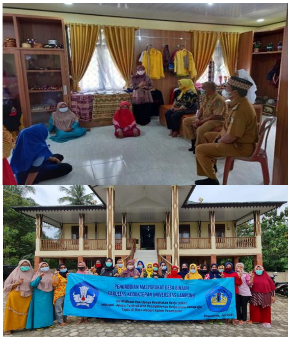
Gambar 2. Pemberian Edukasi

Kegiatan edukasi dapat dilihat pada Gambar 2.