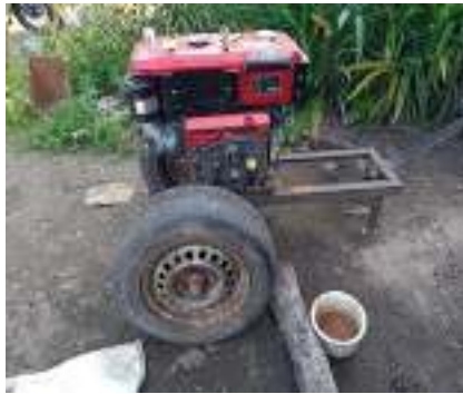
Gambar 2. Purwarupa alat pompa hisap lumpur

Dalam kegiatan ini, telah dirancang 1 unit purwarupa pompa hisap lumpur limbah tambak udang dengan kapasitas 0.5 m 3 /menit dan dilengkapi dengan 10 drum penampung lumpur yang dilengkapi dengan penyaring tambahan.