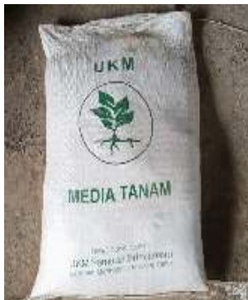
Gambar 3. Media tanam dari limbah lumpur tambak udang

Bimbingan Teknis Tahap pelaksanaan kegiatan diawali dengan bimbingan teknis melalui forum diskusi kelompok (FGD). Kegiatan FGD diikuti oleh 10 peserta petambak udang. Para peserta mendapat pelatihan teori dasar berkenaan dengan cara kerja TZW dan pengolahan lumpur tambak menjadi media tanam, seperti terlihat pada Gambar 3