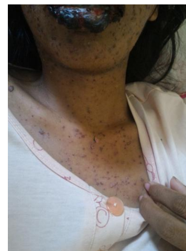
Gambar 4. Dada pasien