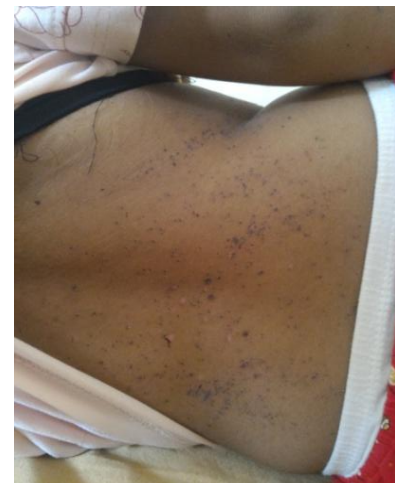
Gambar 3. Badan pasien