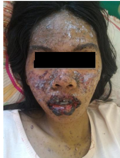
Gambar 2. Wajah pasien

kortikosteroid oral saat pasien pulang. Lalu diberikan pula antibiotik sistemik berupa gentamisin 80 mg/12 jam diberikan selama 5 hari.