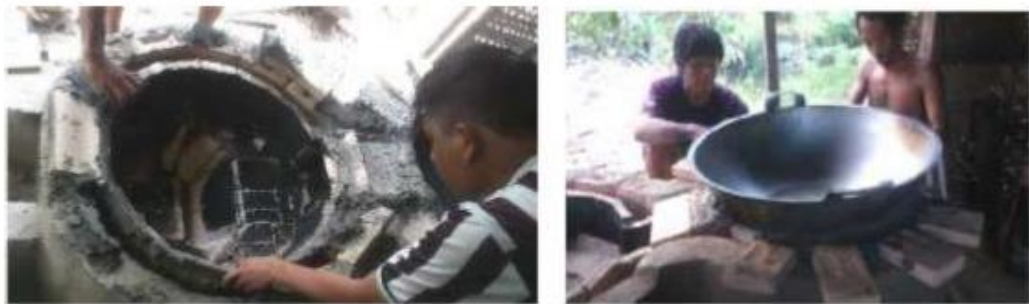
Gambar 3.4 Pemanasan Ruang Bakar Utama Untuk Mengeringkan/ Memperkokoh Perekat Sambungan Yang Digunakan, dan Pembuatan Dudukan Wajan Penggorengan

Selanjutnya, pengerasan perekat dilakukan dengan cara dipanaskan, dilanjutkan pembuatan dudukan wajan penggorengan (silahkan lihat gambar 4)