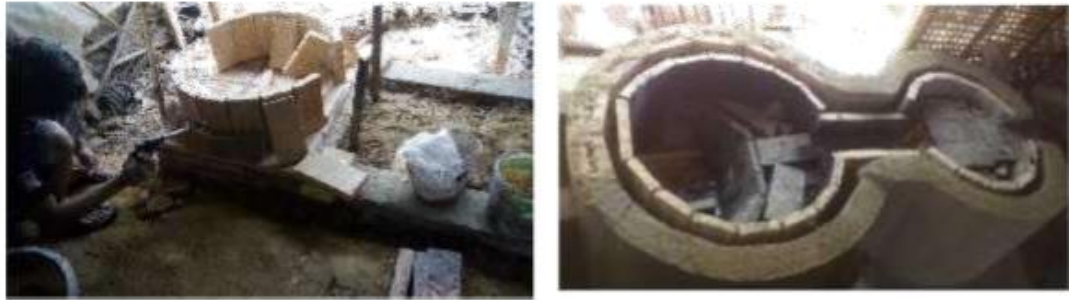
Gambar 3.3 Pemanasan Perakat Ruang Bakar Utama Menggunakan Gas Torch, Pembuatan Kemiringan Sudut Arah Semburan Kompor Solar dan Ruang Bakar Suplai, dan Pembuatan Celah Isolator Heat Losses Dengan Pemasangan Bata Merah Pada Dinding Luar

Selanjutnya, pengerasan perekat dilakukan dengan cara dipanaskan, dilanjutkan pembuatan dudukan wajan penggorengan (silahkan lihat gambar 4)