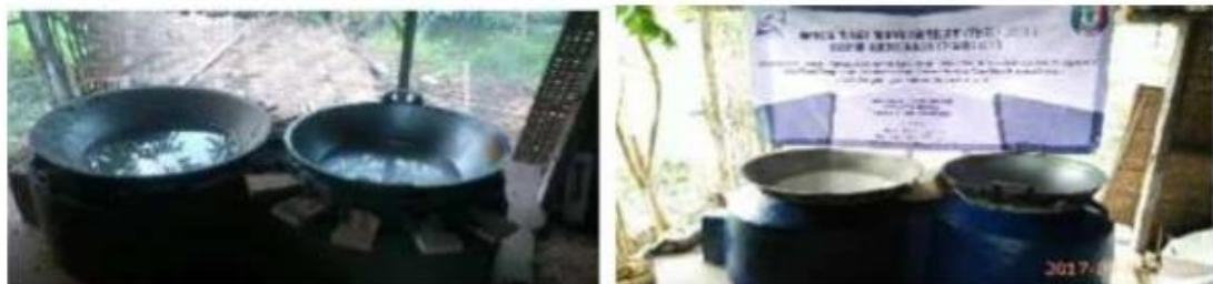
Gambar 3.5 Pemasangan Ceramic Wool Sebagai Perapat Celah Wajan, dan Tungku Bata Api SK32 Telah Rampung dan Siap Digunakan

Tahap berikutnya yaitu pemasangan ceramic wool untuk mencegah heat losses pada bagian bawah wajan. Setelah dikeringkan, dilakukan pengecatan tungku bata api, dan siap untuk digunakan untuk menggoreng kerupuk lempit (silahkan lihat gambar 5).