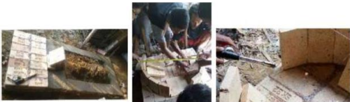
Gambar 3.2 Pembuatan Pondasi dan Lantai Dasar Tungku Bata Api SK32, Dinding Ruang Bakar Utama, dan Pemanasan Perekat Mortar-Sodium Silikat

Pembuatan tungku bata api ini, diawali dengan pembuatan pondasi dari bata merah dan disemen. Selanjutnya di bagian atas lantai dasar pondasi dipasang bata api SK32, yang merupakan lantai dasar tungku bata api. Bata api disambungkan menggunakan perekat mortar-sodium silikat. Setelah selesai disambungkan, perekat ini lalu dipanaskan menggunakan gas torch agar mengeras. Langkah selanjutnya yaitu membuat dinding ruang bakar utama menggunakan bata api SK32. Seperti sebelumnya, perekat antar bata api ini dipanaskan menggunakan gas torch. Untuk lebih jelas dapat dilihat pada gambar 2.