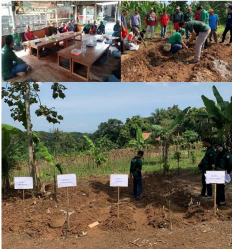
Gambar 2. Kegiatan pengabdian kepada masyarakat di Kelompok Tani Rukun Amrih Sentosa, Kecamatan Sukoharjo, Kabupaten Pringsewu.

Pengolahan lahan dilakukan seminggu sebelum penanaman rumput. Pengolahan dilakukan oleh peternak dengan pengawasan tim pelaksana. Demplot penanaman rumput Pakchong menggunakan lahan petani setempat seluas 400 m 2 (Gambar 2).