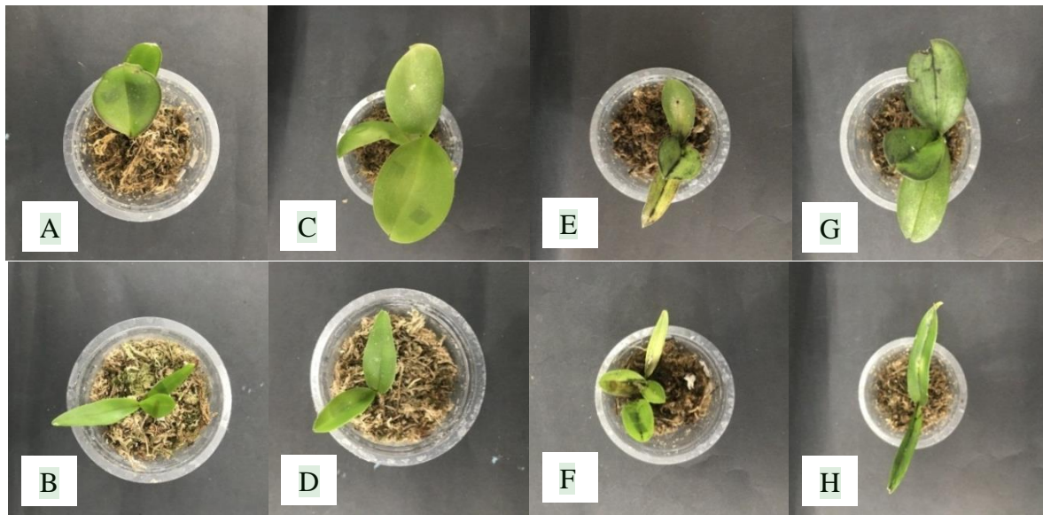
Gambar 1. Perbandingan gejala infeksi ORSV pada anggrek: (A) Phalaenopsis amabilis (kontrol), (B) Dendrobium discolor (kontrol), (C) Phalaenopsis amabilis dengan inokulasi Ceratorhiza sp., (D) Dendrobium discolor dengan inokulasi Ceratorhiza sp., (E) Phalaenopsis amabilis dengan infeksi ORSV, (F) Dendrobium discolor dengan infeksi ORSV, (G) Phalaenopsis amabilis dengan inokulasi Ceratorhiza sp. dan infeksi ORSV, dan (H) Dendrobium discolor dengan inokulasi Ceratorhiza sp. dan infeksi ORSV.

Anggrek A, B, C, dan D tidak menunjukkan gejala infeksi ORSV. Anggrek E menunjukkan gejala mosaik dan klorotik, anggrek F menunjukkan gejala nekrotik dan klorotik, anggrek G menunjukkan gejala nekrotik dan mosaik, dan anggrek H menunjukkan gejala mosaik.