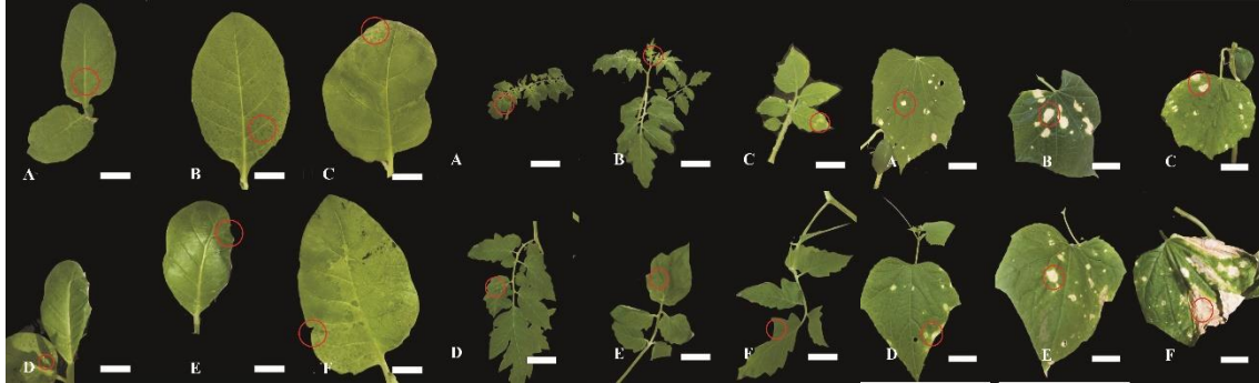
Gambar 1. Gejala infeksi ORSV pada Nicotiana tabacum : Klorotik (A dan B); Mosaik (C dan D); Malformasi daun (E dan F), Solanum lycopersicum : Stunting (A dan B); Mosaik (C dan D); Malformasi daun (E dan F), Cucumis sativus : Nekrotik (A dan F). Bar=1 cm

parah. Pada penelitian sebelumnya (Listihani et al., 2018), diketahui bahwa infeksi ORSV pada tanaman timun menunjukkan gejala klorotik dan mosaik pada hari ke-10 (Gambar 1).