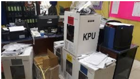
Gambar 1. Logistik PSU TPS 10 Desa Beluluk dan TPS 04 Desa Air Mesu

Logistik yang dibutuhkan selain surat suara ulang, adalah formulir Model C-KPU berhologram dan model C2 –KPU, serta formulir Model C1-PPWP berhologram, Model C1-DPR berhologram, Model C1-DPD berhologram, Model C1-DPRD Provinsi berhologram dan Model C1-DPRD Kabupaten/Kota berhologram yang diberikan tanda khusus bertuliskan PSU, dimasukkan ke dalam masing-masing sampul dan disegel. Berikut persiapan logistik PSU yang telah dilakukan oleh KPU Kabupaten Bangka Tengah :