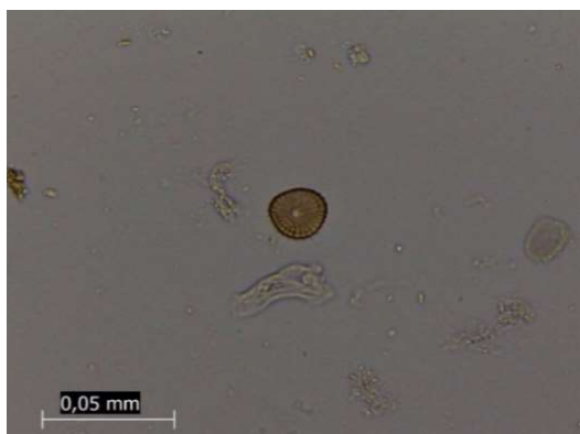
Gambar 3. Oospora yang ditemukan (perbesaran 400×)