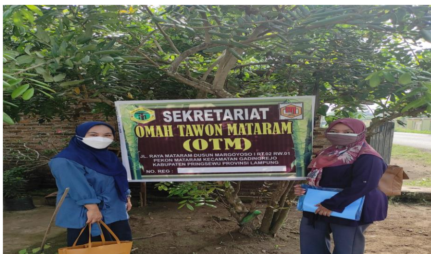
Gambar 1. Sekretariat Omah Tawon Mataram

Selanjutnya kegiatan penyuluhan, kegiatan penyuluhan dilakukan oleh