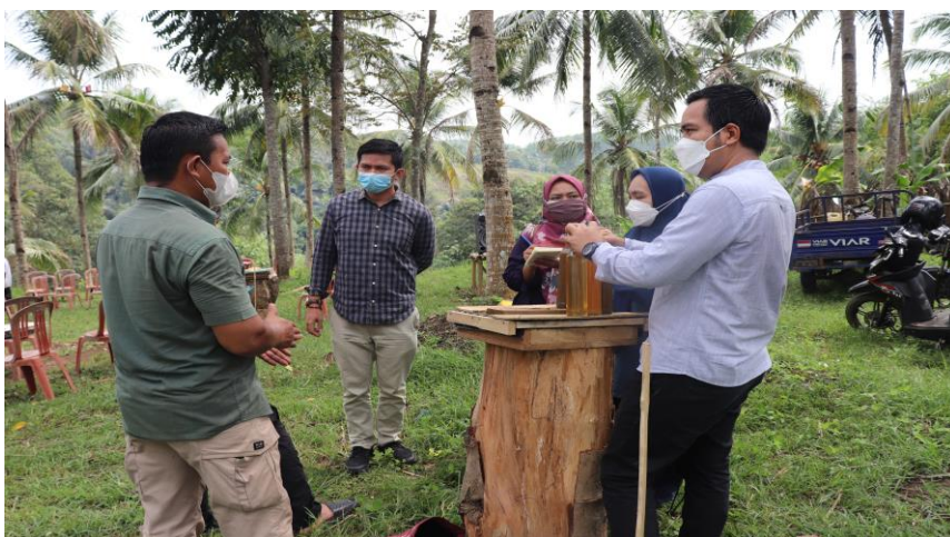
Gambar 4. Madu hasil panen OTM

Selain melakukan kegiatan pemanenan masyarakat juga menujukan madu yang telah dipanen dan siap untuk pasarkan atau dikonsumsi. Pemilihan waktu panen perlu diperhatikan. Menurut Said (2017), pemilihan waktu pemanenan yang salah mengakibatkan jumlah madu yang dipanen sangat sedikit. Panen dilakukan sekitar 2-3 bulan setelah koloni dipindahkan ke dalam wadah (Sebayang et al., 2017). Hasil panen madu di OTM di Sajikan Pada Gambar 2