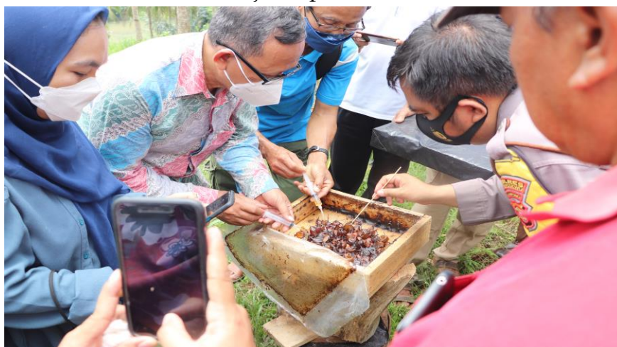
Gambar 3. Pemanen Madu OTM.

Setelah melakukan sesi tanya jawab selanjutnya adalah kegiatan pemanenan Madu, kegiatan pemanenan selain dihadiri oleh kelompok OTM dan para pihak yang terkait dan masyarakat umum. Kegiatan pemanenan madu di OTM Farm disajikan pada Gambar 3.