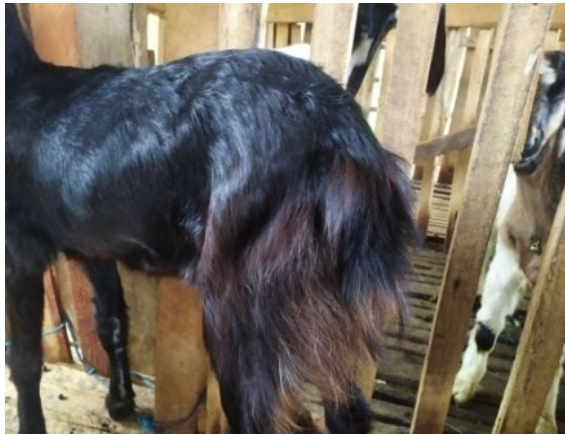
Gambar 10. Surai rambut kambing Rambon

surai rambut dibagian belakang. Surai rambut kambing Rambon betina pascasapah dapat dilihat pada Gambar 10.