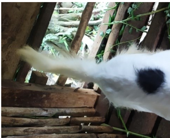
Gambar 4. Pola dominan warna ekor Putih

Berdasarkan hasil penelitian yang didapatkan pola warna pada ekor kambing Rambon betina pascasapih di Desa Sungai Langka memiliki persentase warna putih dominan yaitu sebanyak 82,99%, lalu berwarna coklat sebanyak 6,38%, hitam kombinasi putih sebanyak 6,38% dan berwarna hitam 4,25%. Pola warna ekor kambing rambon betina pascasapih yang dominan (putih) dapat dilihat pada Gambar 4.