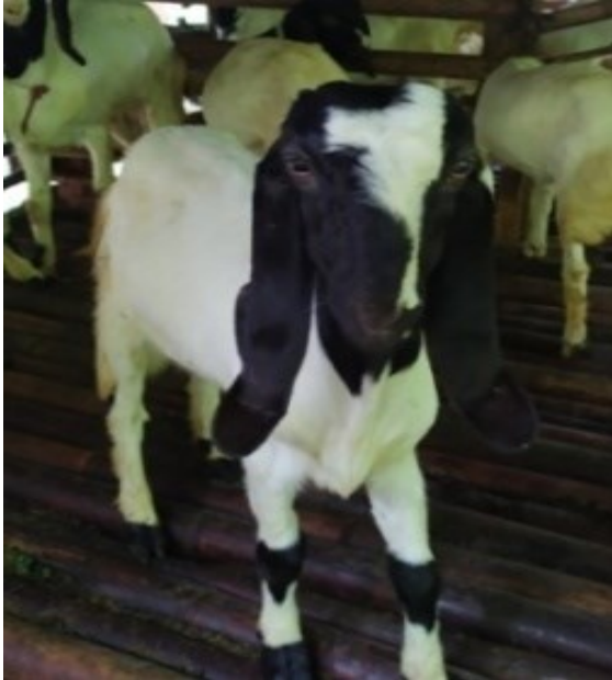
Gambar 1. Pola dominan warna kepala Hitam Kombinasi Putih

berwarna hitam kombinasi putih sebanyak 40,42%, warna putih kombinasi hitam sebanyak 25,53%, warna hitam 27,08%, berwarna coklat kombinasi putih 4,25%, dan berwarna coklat sebanyak 2,13%. Pola warna kepala yang dominan (hitam kombinasi putih) dapat dilihat pada Gambar 1.