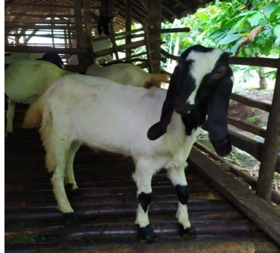
Gambar 2. Pola dominan warna tubuh Putih

belang coklat putih, putih total hitam atau coklat, coklat, putih, maupun hitam serta memiliki tanduk pada jantan maupun betina.