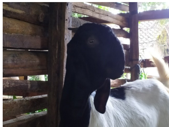
Gambar 9. Pola dominan Profil muka cembung

Berdasarkan hasil penelitian yang didapat profil muka kambing Rambon betina pascasapah di Desa Sungai Langka didominasi oleh bentuk profil muka cembung. Hal ini menunjukkan bahwa profil muka pada kambing rambon mengikuti tetua penjangannya yaitu kambing PE dengan profil muka cembung. Pola profil muka kambing rambon betina pascasapah yang dominan (cembung) dapat dilihat pada Gambar 9.