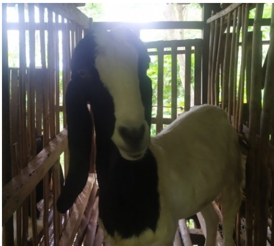
Gambar 7. Pola dominan bentuk telinga panjang, lebar, membuka, dan terkulai

Kambing Rambon betina di Desa Sungai Langka memiliki bentuk telinga sedang, lebar, membuka, dan terkulai sebanyak (19,15%), dan panjang, lebar, membuka, dan terkulai sebanyak (80,85%). Pola bentuk telinga kambing rambon betina pascasapah yang dominan (PLMT) dapat dilihat pada Gambar 7.