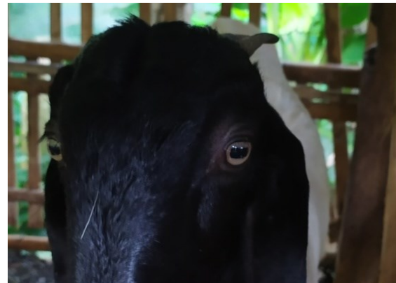
Gambar 8. Pola dominan bentuk mata bulat

bentuk mata kambing rambon betina pascasapah yang dominan dapat dilihat pada Gambar 8.