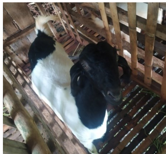
Gambar 6. Pola dominan bentuk tubuh sedang

Bentuk tubuh kambing Rambon betina pascasapih yang terdapat di Desa Sungai Langka memiliki bentuk tubuh pipih sebanyak 38,30%, bentuk tubuh sedang sebanyak 61,70%, dan bentuk tubuh bulat sebanyak 0%. Pola bentuk tubuh kambing rambon betina pascasapih yang dominan (sedang) dapat dilihat pada Gambar 6.