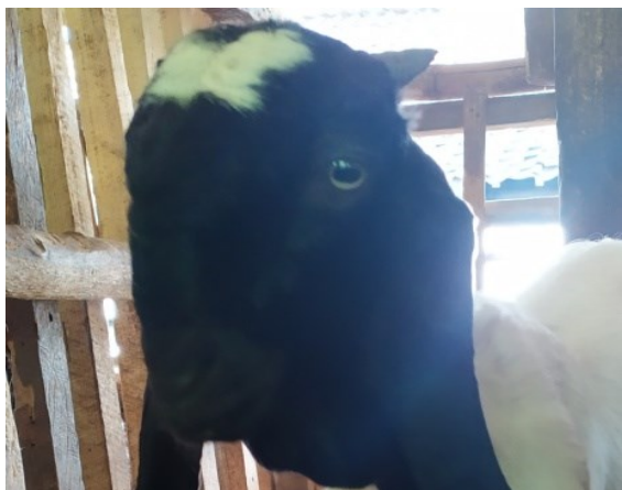
Gambar 11. Pola dominan Bentuk tanduk kecil kebelakang

Berdasarkan hasil penelitian menunjukkan bentuk tanduk kambing Rambon betina pascasapah terdiri atas tanduk kecil kebelakang 89,36%, bentuk tanduk melengkung ke atas ke bawah 4,25%, bentuk tanduk melengkung ke atas ke depan 2,13%, dan tidak bertanduk sebanyak 2,50%. Hal ini menyatakan bahwa bentuk tanduk kambing Rambon pascasapah beragam namun didominasi dengan bentuk tanduk kecil ke atas kebelakang. Pola bentuk tanduk kambing Rambon betina pascasapah yang dominan (tanduk kecil kebelakang) dapat dilihat pada Gambar 11.