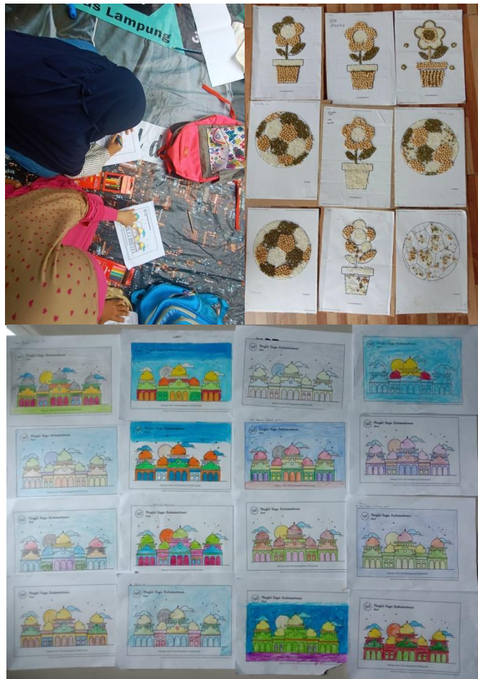
Gambar 5. Kreativitas anak-anak dan hasilnya

Dari kegiatan mewarnai diketahui terdapat beberapa anak yang nalar matematikanya pada predikat kurang, namun mereka memiliki kreativitas yang baik saat mewarnai sebuah gambar. Mereka mampu berimajinasi dan menuangkannya dengan teknik pewarnaan yang harmoni sehingga dihasilkan gambar yang indah. Pada kegiatan pembuatan mozaik, anak-anak berusaha kerjasama untuk menuangkan idenya sehingga terdapat beberapa kelompok yang menghasilkan karya mozaik yang bagus. Mereka menyusun biji-bijian dengan paduan yang cocok sehingga dihasilkan pola yang menarik. Dari kegiatan ini, anak-anak yang menghasilkan karya terbaik diberi hadiah sebagai apresiasi untuk mereka. Karya yang telah dibuat oleh anak-anak ini dibagikan kepada orang tuanya melalui media sosial WhatsApp agar mereka mengetahui bakat dan kreativitas anaknya dengan harapan kelak mereka bisa mengarahkan pendidikan anaknya sesuai dengan minat dan bakatnya. Anak-anak sangat senang mengikuti kegiatan ini karena dapat bermain sambil belajar.