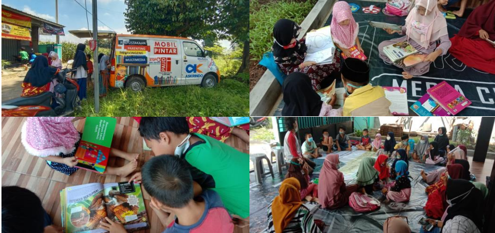
Gambar 6. Kunjungan mobil pintar dan pemberian motivasi oleh crew di Rumah Belajar Garasi

untuk mengeksplorasinya karena paduan berbagai warna yang ada di dalam buku membangkitkan motivasi, perasaan, dan perhatian anak-anak (Purnama, 2010). Mereka sangat antusias membaca buku satu demi satu karena sangat menarik bagi mereka. Mereka juga mendapatkan game ringan dan motivasi dari crew mobil pintar agar mereka senang membaca buku seperti ditunjukkan pada Gambar 6.