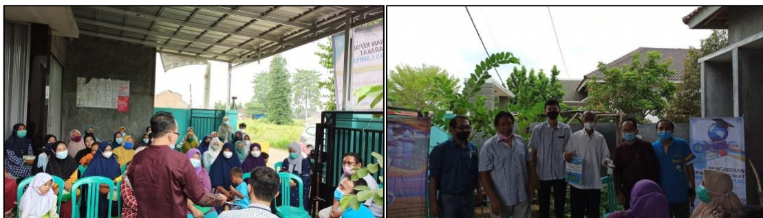
Gambar 3. Kegiatan sosialisasi kepada orang tua warga dan penyerahan Garasi kids secara simbolik kepada ketua RT setempat

Agenda pengabdian selanjutnya adalah sosialisasi kepada orang tua yang ditujukan untuk menggali problematika mereka selama sekolah daring diterapkan. Kegiatan ini diikuti oleh 33 peserta dan dihadiri oleh ketua RT setempat seperti pada Gambar 3. Melalui diskusi interaktif, tim pengabdian mengetahui beberapa problematika yang dihadapi orang tua selama kegiatan belajar daring. Beberapa problematika utama yang dihadapi orang tua, antara lain: (1) keterbatasan latar belakang pendidikan menyebabkan mereka sulit untuk mengajari anaknya, (2) meningkatnya kebutuhan belanja kuota internet karena harus berinteraksi dengan guru di sekolah dan untuk kebutuhan mencari penyelesaian dari tugas-tugas anaknya di internet, dan (3) merasa bahwa anaknya tidak bisa mengikuti kegiatan belajar daring dengan baik.