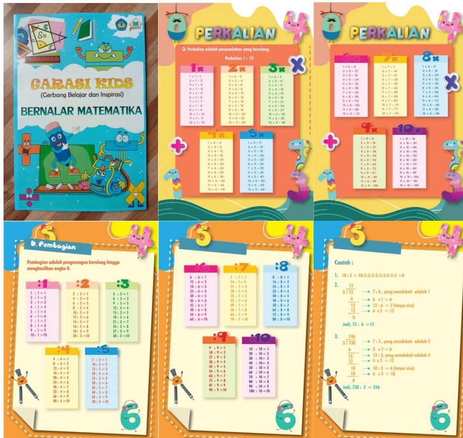
Gambar 2. Halaman sampul dan beberapa contoh materi di dalam modul Garasi kids

Agenda pengabdian selanjutnya adalah sosialisasi kepada orang tua yang ditujukan untuk menggali problematika mereka selama sekolah daring diterapkan. Kegiatan ini diikuti oleh 33 peserta dan dihadiri oleh ketua RT setempat seperti pada Gambar 3. Melalui diskusi interaktif, tim pengabdian mengetahui beberapa problematika yang dihadapi orang tua selama kegiatan belajar daring. Beberapa problematika utama yang dihadapi orang tua, antara lain: (1) keterbatasan latar belakang pendidikan menyebabkan mereka sulit untuk mengajari anaknya, (2) meningkatnya kebutuhan belanja kuota internet karena harus berinteraksi dengan guru di sekolah dan untuk kebutuhan mencari penyelesaian dari tugas-tugas anaknya di internet, dan (3) merasa bahwa anaknya tidak bisa mengikuti kegiatan belajar daring dengan baik.