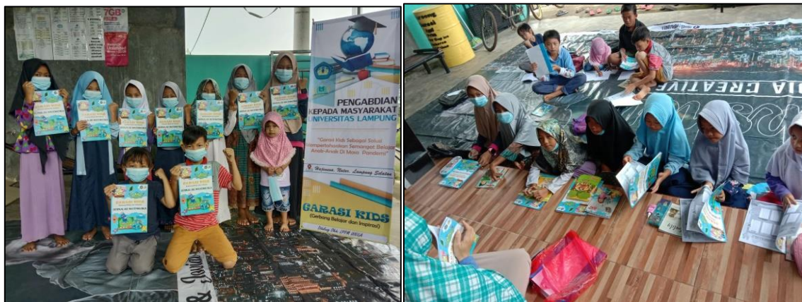
Gambar 4. Kegiatan pendampingan belajar di Rumah Belajar Garasi

Tahap selanjutnya dari kegiatan pengabdian ini ialah pendampingan belajar untuk anak-anak yang dilaksanakan pada setiap akhir pekan oleh tim pengabdian beserta pengelola Rumah Belajar Garasi. Peserta kegiatan ini berjumlah 19 anak SD yang dibagi menjadi 3 kelompok. Setiap kelompok di dampingi oleh satu pendamping dan mereka diajari materi bernalar matematika sesuai dengan materi yang dimuat di dalam Garasi kids . Materi yang telah berhasil diajarkan kepada anak-anak selama kegiatan pengabdian ini ditunjukkan pada Tabel 2. Dalam kegiatan pendampingan ini, anak-anak dilatih daya serapnya terhadap materi dan diasah kemampuannya. Mereka diminta mengerjakan soal-soal secara bergiliran untuk menumbuhkan keberanian dan kepercayaan dirinya. Aktivitas pendampingan anak-anak ditunjukkan pada Gambar 4.