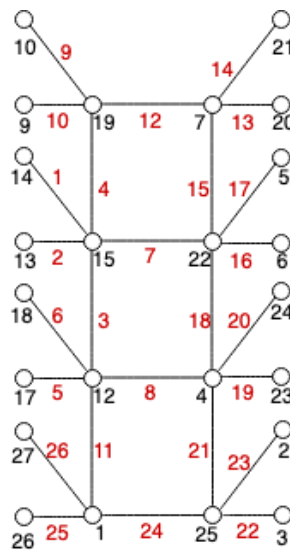
Gambar 2. Pelabelan \hat{\rho} pada Graf L_4 \odot \bar{K}_2

Pada Gambar 2 diberikan contoh pelabelan \hat{\rho} pada graf L_4 \odot \bar{K}_2 .