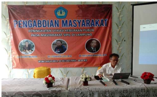
Gambar 1. Penyampaian Paparan Materi

Kedua , menyusun materi penyuluhan yang mudah dimengerti dan bisa dijadikan rujukan untuk melakukan respons terhadap kebijakan publik di daerah yang dianggap bermasalah atau kontroversi yang berdampak aspek kemanfaatan kebijakan pemerintah tersebut tidak bisa menyelesaikan masalah publik. Secara garis besar materi tersebut terdiri atas: (a) Isu-isu kebijakan publik, (b) Peran kekuatan masyarakat sipil dalam merespons kebijakan publik di daerah yang dinilai bermasalah dan (c) materi lain yaitu diskusi dan pengalaman peserta dalam menanggapi persoalan – persoalan kebijakan di Lampung.