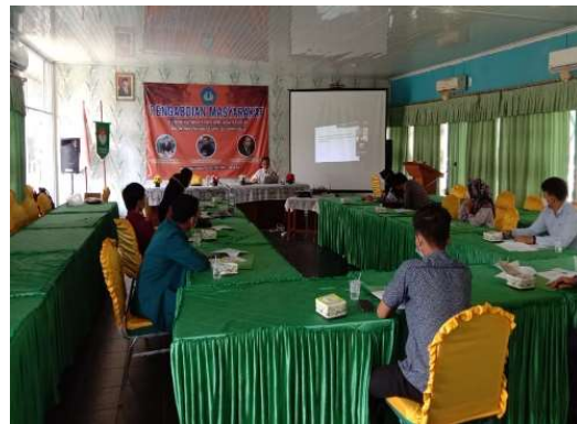
Gambar 2. Kegiatan Diskusi

pemerintahan dan korupsi. Mereka memperoleh informasi dari koran, diskusi/seminar dan yang paling banyak dari media sosial. Namun, umumnya juga mereka punya keterbatasan untuk melakukan kontrol terhadap proses perumusan kebijakan publik, tata kelola pemerintahan dan korupsi.