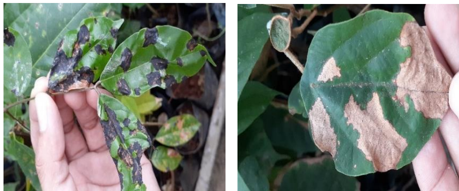
Gambar 4. Penyakit bercak daun pada bibit mahoni ( Swietenia macrophylla ) dan bayur ( Pterospermum javanicum ) di persemaian PT Natarang Mining Figure 4. Leaf spot disease on mahogany ( Swietenia macrophylla ) and bayur ( Pterospermum javanicum ) seedlings in the Nursery of PT Natarang Mining