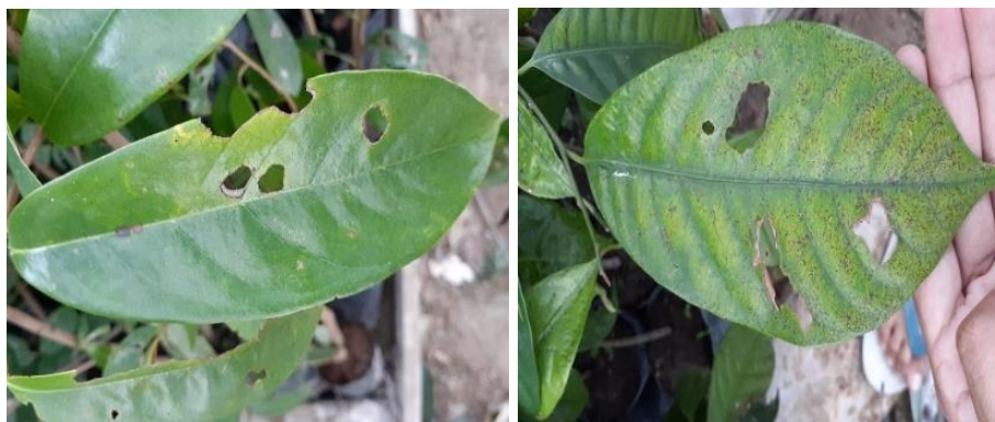
Gambar 3. Serangan hama siput pada bibit tanaman sirsak ( Annona muricata ) dan pala ( Myristica fragrans ) di persemaian PT Natarang Mining.

Siput ini biasanya memakan daun dan akar yang masih muda pada malam hari. Kerusakan yang ditimbulkan oleh hama ini adalah lubang yang tidak beraturan pada daun bibit tanaman hutan yang menyebabkan daun menjadi lambat tumbuh. Selain itu, siput jenis ini juga dapat merusak batang dan akar bagian bawah sehingga batang dan akar akan menjadi rusak. Hama ini sangat menyukai tempat yang lembab dan biasanya bersembunyi di bawah polybag atau seresah yang ada di sekitar bibit (Hardi & Mahfudz, 2012).