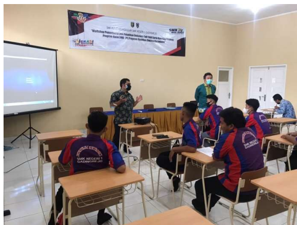
Gambar 2. Tim pelaksana sedang memperkenalkan diri sebelum pemberian materi sosialisasi teknologi tentang pompa tanpa motor.

Evaluasi juga diberikan kepada peserta, dimana tes awal dan tes akhir dirancang untuk mengetahui secara jelas tingkat kemampuan yang dicapai oleh masing-masing peserta. Pertanyaan-pertanyaan yang diberikan pada kuisioner terdiri dari 10 pertanyaan. Semua pertanyaan yang diberikan tersebut terdiri dari 5 materi pokok yaitu: pengetahuan tentang dasar-dasar prinsip kerja pompa pompa tanpa motor, pengetahuan tentang bahan pembuatan pompa tanpa motor, pengetahuan tentang proses pembuatan pompa tanpa motor, dan pengetahuan tentang pemasangan dan pengoperasian dan perawatan pompa tanpa motor.