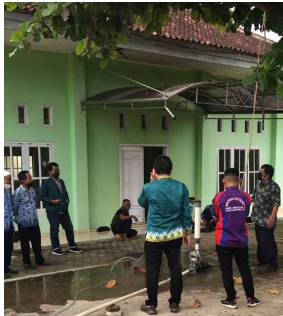
Gambar 6. Tim pelaksana sedang memberikan penjelasan pengoperasian pompa tanpa motor kepada siswa-siswa dan guru-guru yang mengikuti kegiatan.

Berdasarkan kegiatan yang dilakukan, dapat dilihat bahwa antusias siswa-siswa dan guru-guru mengikuti kegiatan ini sangat tinggi. Hal ini terbukti dengan sikap mereka yang serius dan banyak mengajukan pertanyaan saat pelaksanaan pemberian materi teori dan praktek tentang pemasangan, dan pengoperasian pompa tanpa motor ( hydram pump ). Karena ini memberikan informasi baru bagi mereka bahwa ada pompa yang dapat bekerja tanpa menggunakan motor bensin atau motor listrik. Dan mereka berniat ingin mengaplikasikan penggunaan pompa ini untuk membantu irigasi pertanian mereka, dengan tetap meminta bantuan bimbingan dari tim pelaksana Fakultas Teknik UNILA dalam pembuatan dan pengoperasiannya di lapangan.