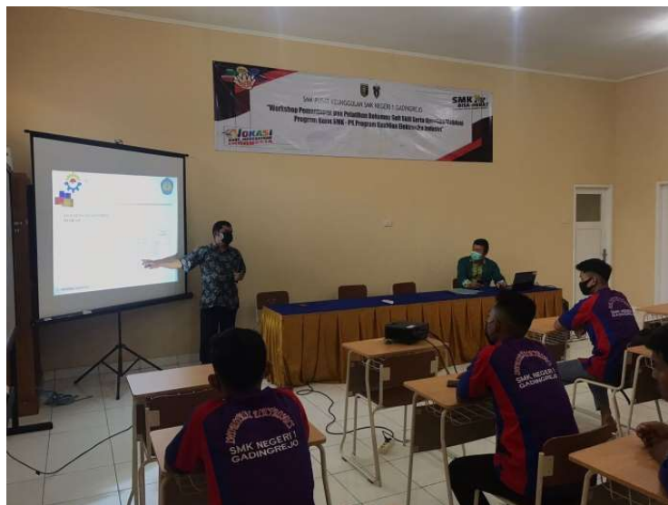
Gambar 3. Tim pelaksana sedang memberikan materi sosialisasi tentang prinsip kerja dan komponen-komponen pompa tanpa motor.