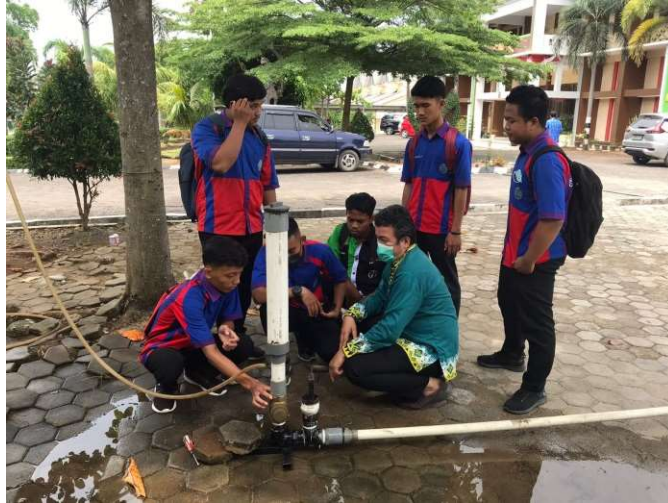
Gambar 5. Tim pelaksana sedang memberikan penjelasan komponen-komponen dan cara kerja pengoperasian pompa tanpa motor.