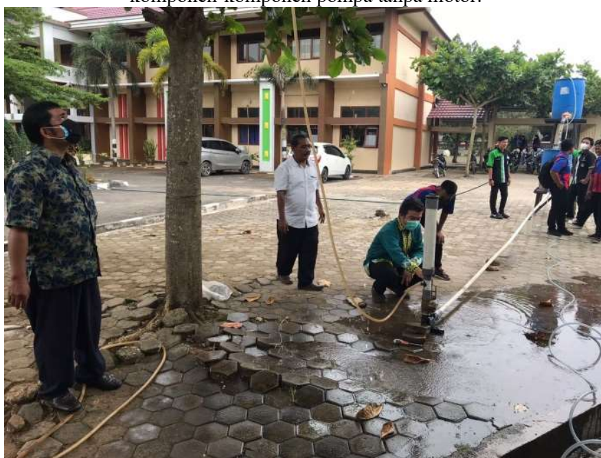
Gambar 4. Tim pelaksana sedang melakukan pemasangan untuk demonstrasi pengoperasian pompa tanpa motor.